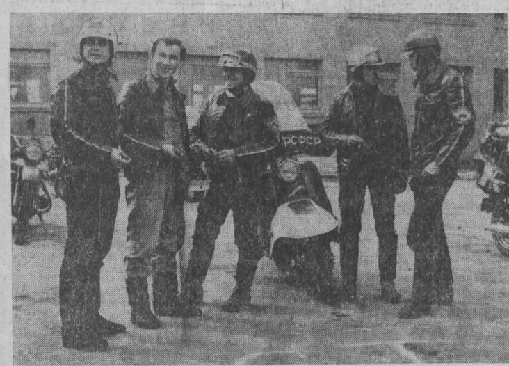
Недавно студенческий отряд мотороллеристов Кемеровского государственного института культуры отправился на соревнования в г. Минск (Мелбинская обл.), где будет проходить первенство РСФСР. Но прежде их путь до места соревнований пройдет через Фергану, Ташкент, Кустанай, Протажин...