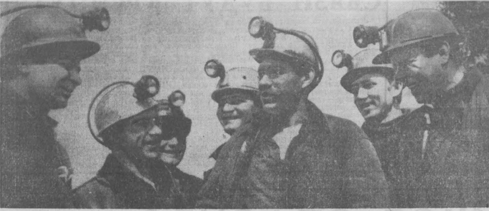
Свыше 50 тысяч тонн сверхпланового угля выдали с начала года горняки шахты «Байдаевская» комбината «Южкузбассуголь». Особенно славятся трудятся на шахте коллектив участка № 10. Мощность пласта, который отработывают горняки этого участка, более четырех метров. Из лавы уголь идет мощным потоком. С начала года перевод коллектив сумел добыть сверх плана около 15 тысяч тонн топлива.