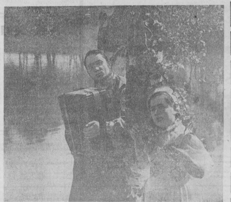
ХОРОШИ ВЕЧЕРА НА ТОМИ...

Тогда в массовом количестве появляются грибы, появляющиеся в июне, и высыпают рынчики, волнушки, грибочки, опята, маслята. Грибные шестые продолжаюте до самого октября. Заканчиваются у нас грибной сезон весельями опятами. Народная фенология вела термин: «грибной слой». Издавна замечено, что грибы чаще всего появляются именно слоями. Подберезовики, подосиновники — ровесники рынчатого колоса. Когда начнут сею смечуть в стога и наступит пора уборки, озимых — народится «слой» среднелетних грибов. Самый длительный и урожайный слой — грибы «листопадники» — ровесники брусники и кедровых орехов. В эту пору целыми семьями высыпают подберезовики, подосиновники, грузди, рынчики, белые грибы, маслята. А о начале массового плодоношения грибов вам подскажут густые августовские туманы. И. ДМИТРИЕВ, г. Кемерово.