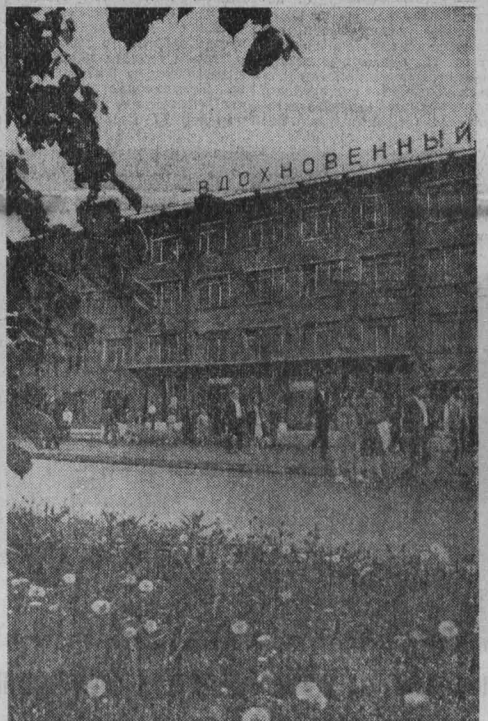
НА СНИМКАХ: голосуют жители нового микрорайона областного центра на избирательном участке № 83, расположенном в здании школы № 45; ранним утром люди бьют в уда, индустриального техникума на проспекте Ленина, г. Кемерово.