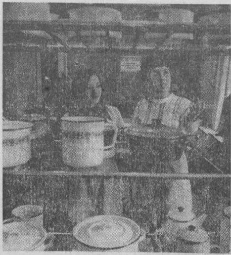
Недавно в Новокузнецке открылась выставка товаров народного потребления, в которой принимают участие около двадцати предприятий города...