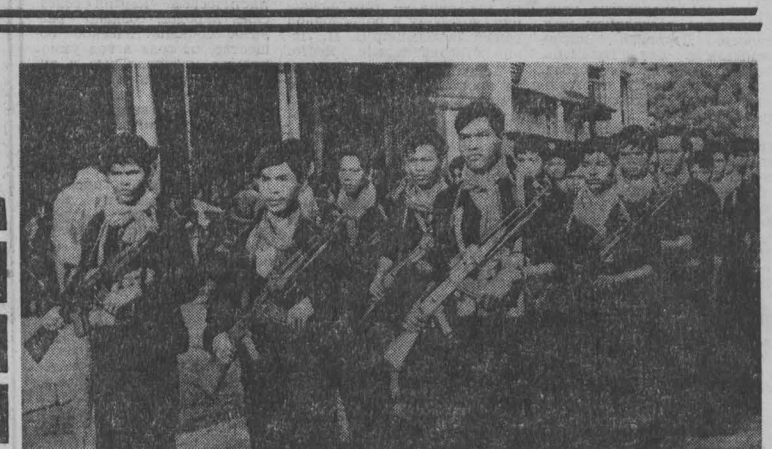
КАМБОДЖА. Народные вооруженные силы национального освобождения ведут наступательные действия в районе Пномпеня. Борьбу патриотов поддерживают широкие слои населения. В народные силы освобождения вливаются все новые отряды бойцов. НА СНИМКЕ: подразделение патриотических сил.

разногласия между Советом Союза и Советом Национальностей вопрос передается на разрешение согласительной комиссии, образуемой палатами на паритетных, равных началах. Если комиссия не приходит к согласному решению или если ее решение не удовлетворяет одну из палат, вопрос рассматривается вторично в палатах. При отсутствии согласного решения обеих палат Президиум Верховного Совета СССР уполномочен распустить Верховный Совет СССР и назначить новые выборы.