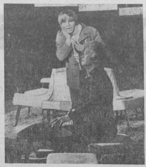
В. ВЛАДИМИРОВА. НА СНИМКЕ: сцена из спектакля «Странная миссис Сэвидж».