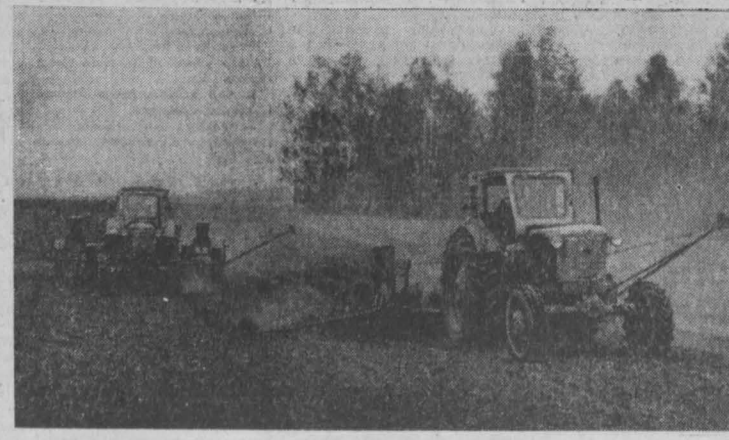
Кемеровский район.

итоги рейда по экономии и бережливости. В нем участвовали сотни рабочих, инженеров, техников, работников и служащих. Многие бригады и смены работали в день летнего коммунистического субботника на самоомленном сырье и электроэнергии.