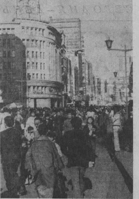
Сегодняшний Токио — столица Японии — представляет собой яркое сочетание старого и нового. В архитектуре, обычаях и традициях отражается прошлое и настоящее страны.

БОНН. (ТАСС). Канцлер ФРГ Г. Шмидт высказался в интервью западногерманскому радио за дальнейшую нормализацию отношений между ФРГ и ГДР.