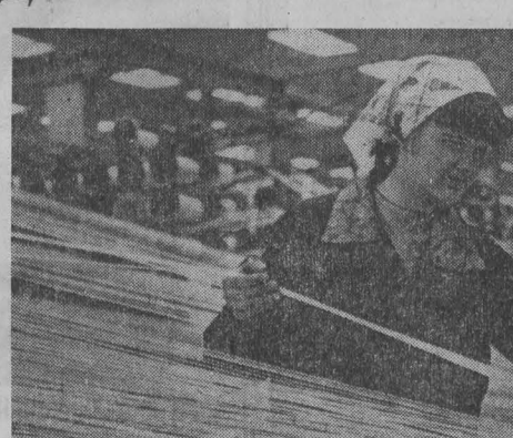
Завод химического волокна выпускает нора для автомобильной промышленности и технического волокна. Его коллектив успешно осваивает оборудование и на днях выборов предполагает вывести производство нора на проектную мощность. Одновременно здесь идет монтаж оборудования второй очереди.