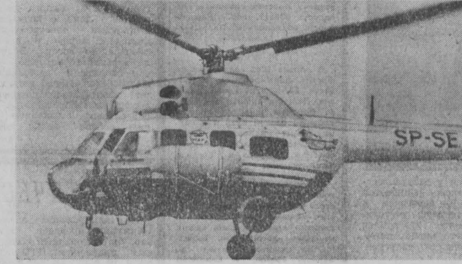
ПНР. Вертолет Ми-2, выпускаемый Санднинским заводом транспортных средств по советской лицензии.