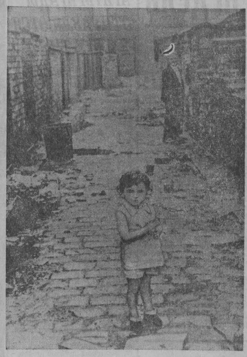
Более двухсот лет понадобится для того, чтобы ликвидировать трущобы в Великобритании при нынешних темпах жилищного строительства, — говорится в опубликованном докладе английской общественной организации «Шелтер».

По данным доклада, свыше двух миллионов домов на Британских островах сейчас полностью непригодны для жилья. Еще около пяти миллионов домов — треть всего жилого фонда страны — находится в неудовлетворительном состоянии. Это означает, что сотни тысяч английских семей живут в крайне тяжелых условиях, в домах-трущобах, непригодных для проживания.