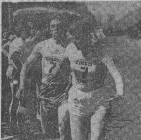
НА ПРИЗ ГАЗЕТЫ «КУЗБАСС»