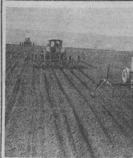
● НА ВЕСЕННЕМ ПОЛЕ

Состоялось заседание окружной избирательной комиссии Кировского избирательного округа Ленинграда по выборам в Совет Союза. Единственно принято постановление зарегистрировать кандидатом в депутаты Верховного Совета СССР по Кировскому избирательному округу Ленинграда члена Политбюро ЦК КПСС, секретаря ЦК КПСС Михаила Андреевича Суслова. В Свердловске состоялось заседание окружной избирательной комиссии Чкаловского избирательного округа по выборам в Совет Союза. Комиссия единогласно приняла постановление зарегистрировать кандидатами в депутаты Верховного Совета СССР по Петровскому избирательному округу члена Политбюро ЦК КПСС, секретаря ЦК КПСС Андрея Павловича Кирилленко кандидатом в депутаты Совета Союза Верховного Совета СССР по Чкаловскому избирательному округу города Свердловска. (ТАСС). Продолжается регистрация кандидатов в депутаты Верховного Совета СССР избирательными комиссиями округов, расположенных на территории нашей области. В понедельник состоялось заседание окружной избирательной комиссии Рудничного избирательного округа № 190 по выборам в Совет Союза Верховного Совета СССР. Комиссия зарегистрировала давшего согласие баллотироваться кандидатом в депутаты по этому округу Мельникова Леонидом Георгиевичем, председателем Государственного комитета по надзору за безопасным ведением работ в промышленности и горному надзору при Совете Министров СССР. Окружная избирательная комиссия Анжеро-Судженского округа № 191 зарегистрировала кандидатом в депутаты Совета Союза