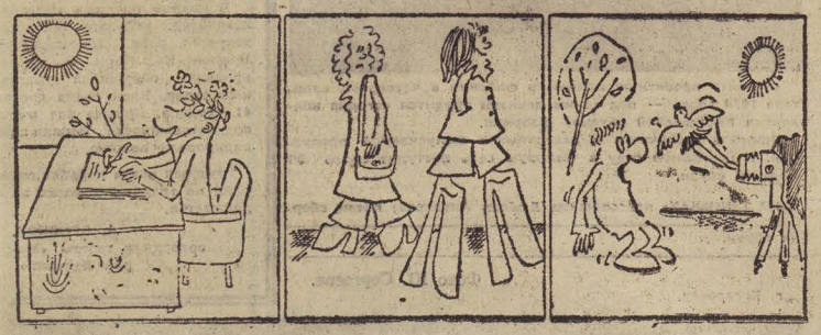
Рис. В. Андрианова.