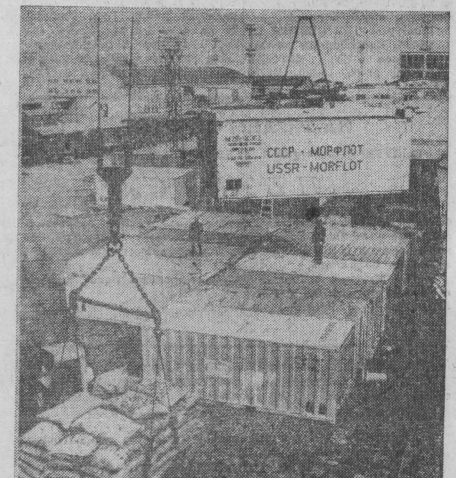
Контейнерная система перевозок приобретает в Народной Республике Болгария все большее экономическое значение. На железнодорожных станциях, пристанях, автостанциях оборудованы специальные терраны для перевозки контейнеров с подъемными механизмами и транспортерами. На СНИМКЕ: в Варненском порту идет разгрузка контейнеров, доставивших товары из Советского Союза.

Трудящиеся металлургической и сталелитейной промышленности КНДР вступили в третий год шестилетки. Они знают, что для развития промышленности их страны нужно больше металла. Вот почему они обратились к призывам ко всем предприятиям республики досрочно выполнять годовые планы. Для этого надо повысить коэффициент использования оборудования, более рационально использовать рабочее время, технику. О том, чего можно добиться, используя все имеющиеся из предприятий внутренние резервы, говорит опыт Тянского электромеханического завода. Ф. ЛЕСКОВ, (АПН).