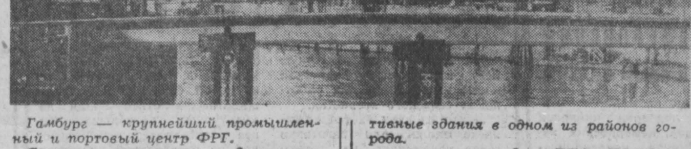
Гамбург — крупнейший промышленный и портовый центр ФРГ. Старые и современные административные здания в одном из районов города.