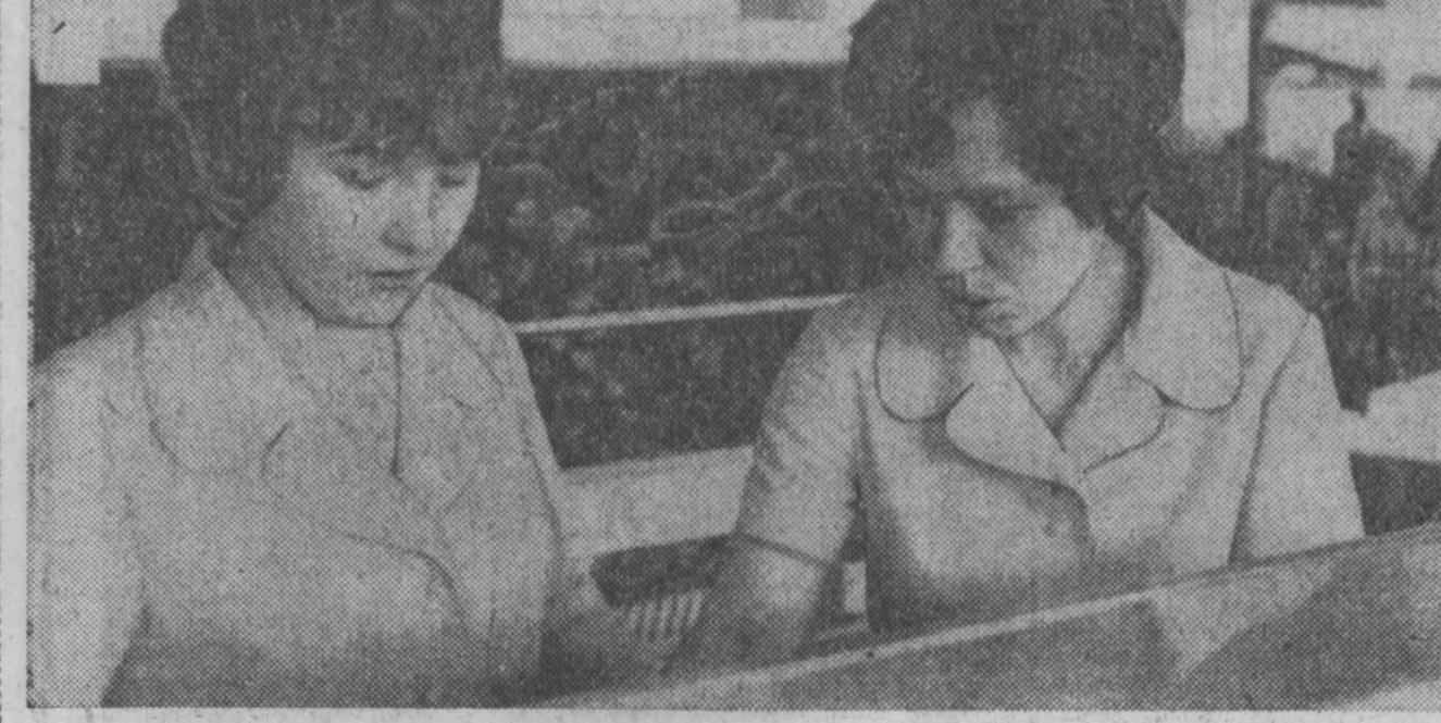
На днях гостеприимно распахнулись двери нового продовольственного магазина ордена «Знамя Труда» по Горловскому шоссе...