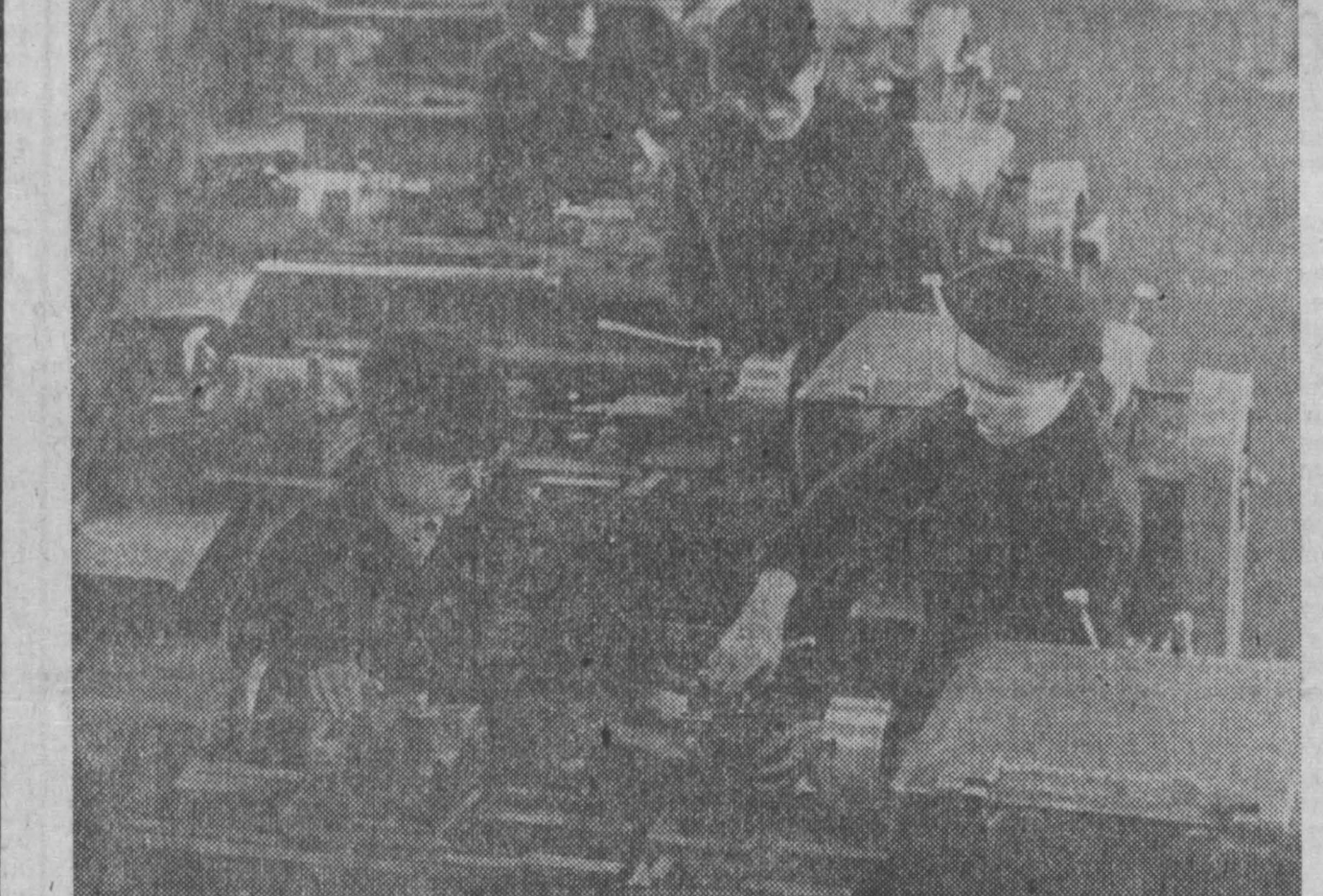
В индустриальном Кузбассе трудно назвать предприятие, где бы не трудился бы специалист профессионально-технической школы нашей области. Прокловское ПТУ-41 располагает отличными мастерскими.

Городская комиссия по проведению праздника.