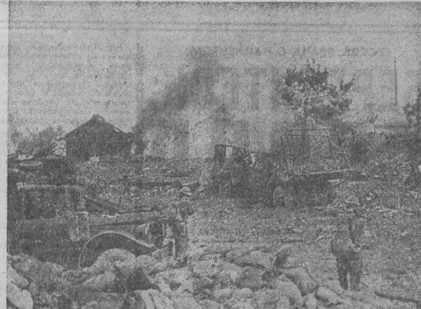
ЮЖНЫЙ ВЬЕТНАМ. Патриоты Народных вооруженных сил освобождения после интенсивной ракетно-артиллерийской подготовки атакуют вражеские позиции на Центральном плато (на снимке).