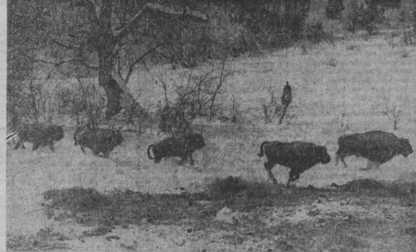
Необычайно суровая и снежная зима стояла в этом году в горах Киргизии...