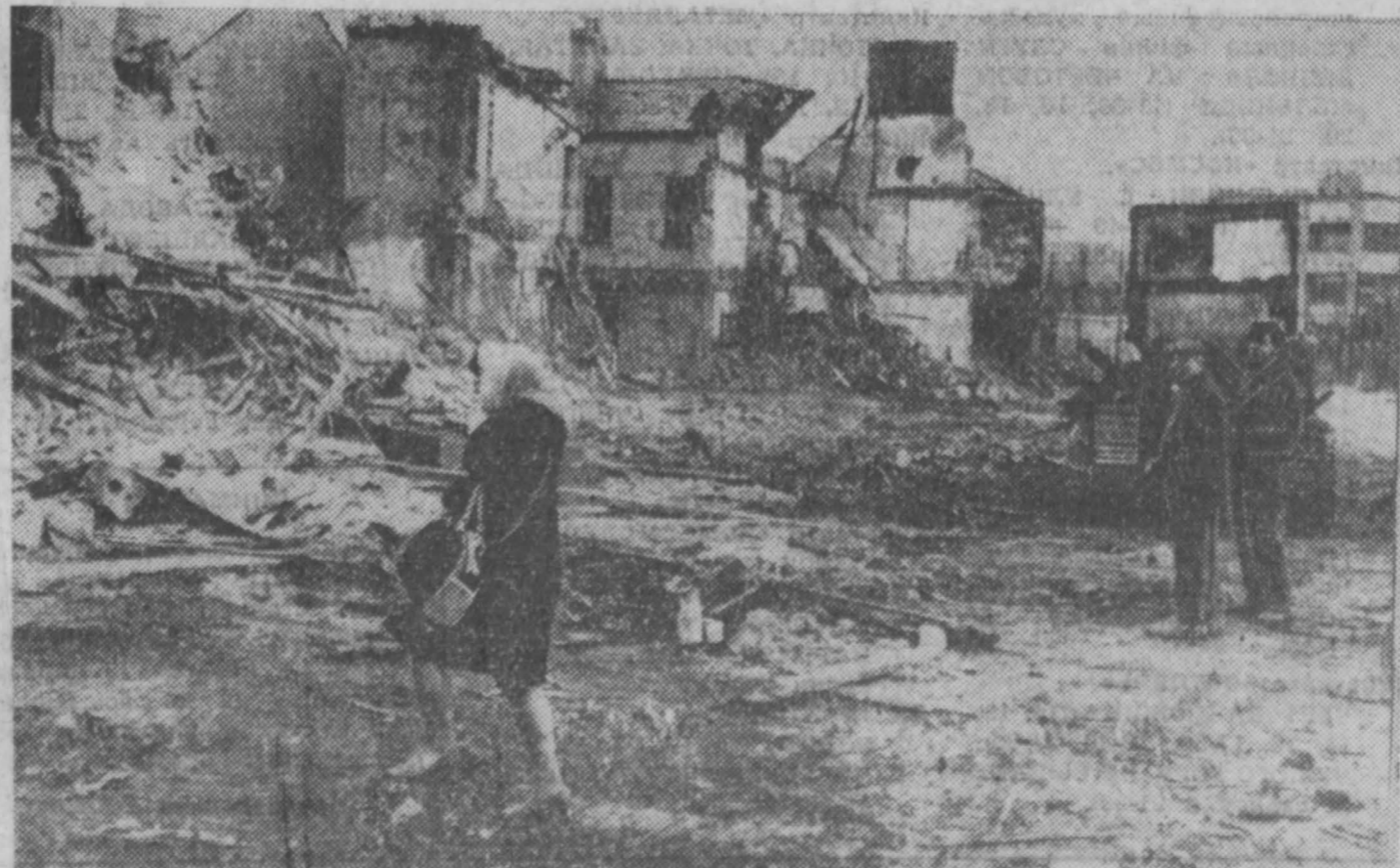
Террор ультраправых экстремистов вошёл в будничную жизнь многих жителей Ольстера. Каждый день приносит в эти отстрашенные Велфасте.

канский военный персонал численностью в 825 человек, пришедший делегация США в четырёхсторонней совместной комиссии, а также 150 морских пехотинцев для охраны американского посольства в Сайгоне и 50 офицеров при военном аташе американского посольства. С начала 1961 года по момент подписания в Пари-