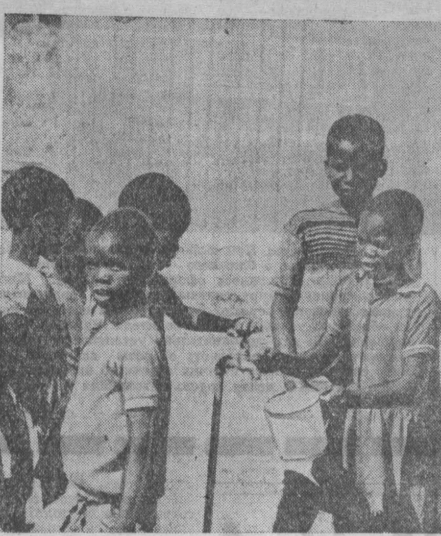
пается дешевая рабочая сила. Не случайно поэтому туристские маршруты проходят в стороне от этих южноафриканских концлагерей. НА СНИМКЕ: маленькие поселенцы резервации Ету-вунци в провинции Наталь.

В течение многих лет правительство Форстера проводит в жизнь жесткую, бесчеловечную политику по уничтожению «черных пятен на белой земле». Ежегодно около 100 тысяч африканцев насильно изгоняются из районов, на которые претендуют белые, в слаборазвитые и часто уже переполненные резервации — «бантустаны» и другие специальные поселки. Такие поселения расположены среди бесплодной выжженной солнцем степи. Здесь нет промышленности, полезных ископаемых. Население их обречено на медленную смерть от голода, болезней и нищеты. Гонимые безысходным положением, мужчины уходят на заработки в близлежащие города и на фермы, где вынуждены соглашаться на любые условия найма. «Бантустаны» стали гигантскими загонями для современных рабов, откуда чер-