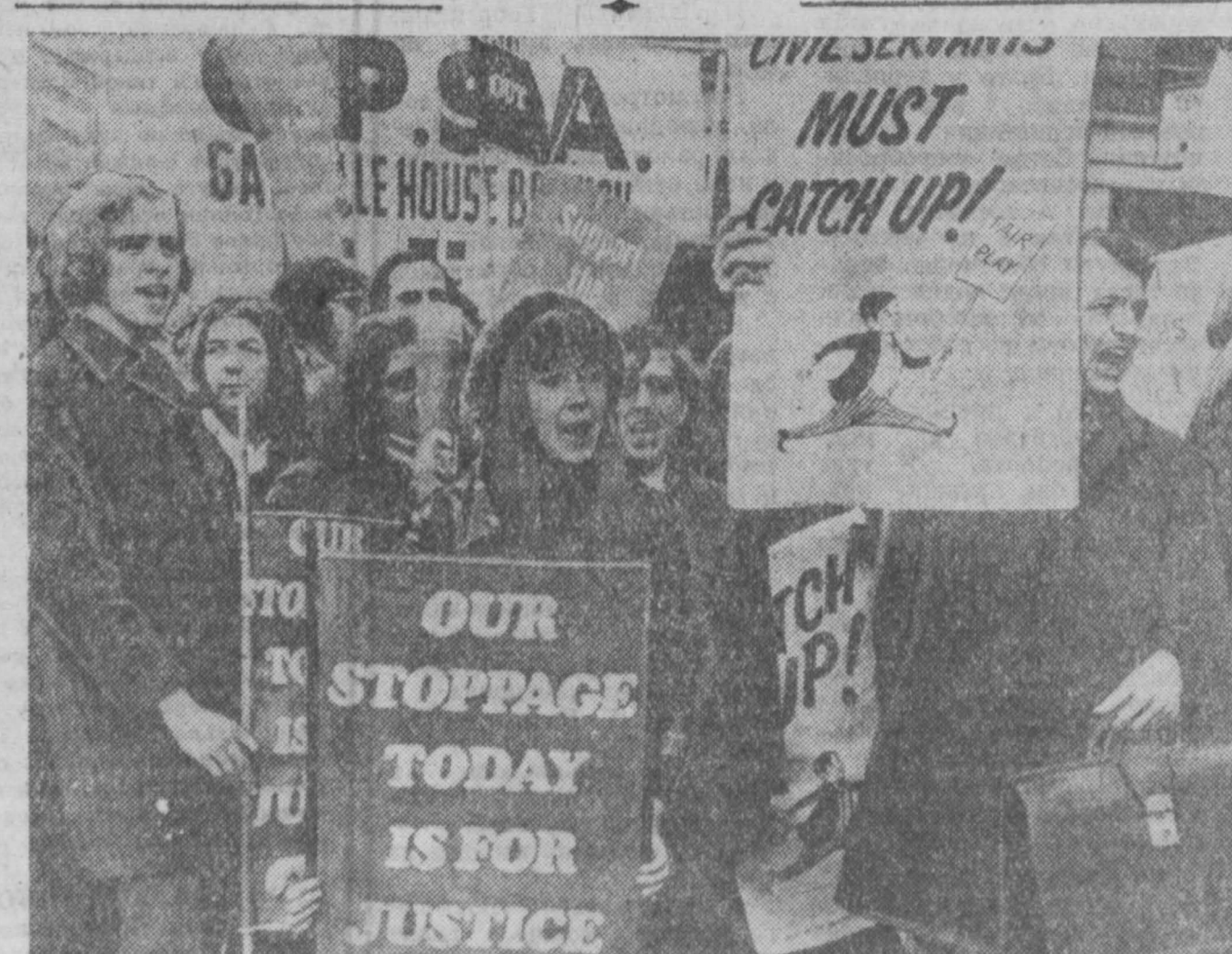
АНГЛИЯ. Впервые в истории страны провели общенациональную забастовку около 300 тысяч государственных служащих, лояльность которых правящему классу иногда раньше не подвергалась сомнению. Однако наступление консервативного правительства на жизненный уровень английских трудящихся приобрело такие масштабы, что забастовали даже «белые воротнички» (так называют в Англии служащих). НА СНИМКЕ: во время выступления государственных служащих в Лондоне.