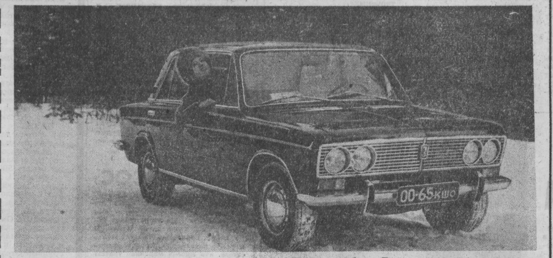
На Волжском автомобильном заводе освоены выпуск новой модели малолитражного автомобиля «Жигули» («Лада») — ВАЗ-2103.

Письма дороги каждому. Тряхнув дорожки от пыли. Потому что почти любой человек, когда ему станет невмочь разлуки, может в конце концов попросить отпустить, взять билет на самый быстрый транспорт.