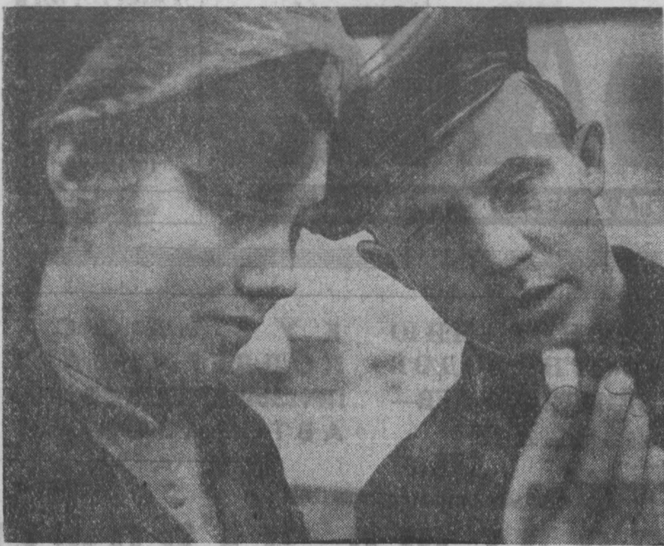
Десятки тысяч сверхплановых подшипников ежемесячно отправляет потребителям государственный подшипниковый завод № 14. Успеху способствует внедрение рационализаторских предложений, новшества, установка нового высокопроизводительного оборудования. Так, например, в шлифовально-сборочном цехе № 1 заменены все старые станки на современные шлифовальные автоматы.