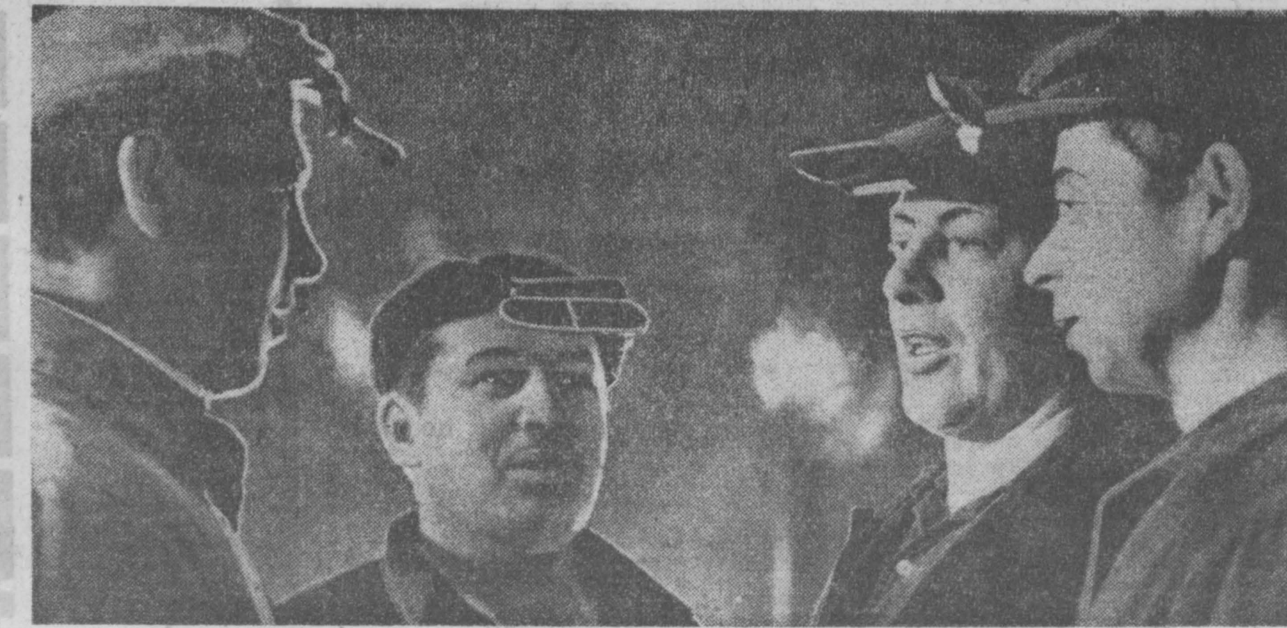
В ходе переговоров делегация обсудила широкий круг вопросов, интересующих обе партии. Было условлено опубликовать совместное коммюнике об итогах переговоров. (ТАСС).

В числе провожающих находился посол Ирана в СССР Мохаммед Р. Амир Теймур. (ТАСС).