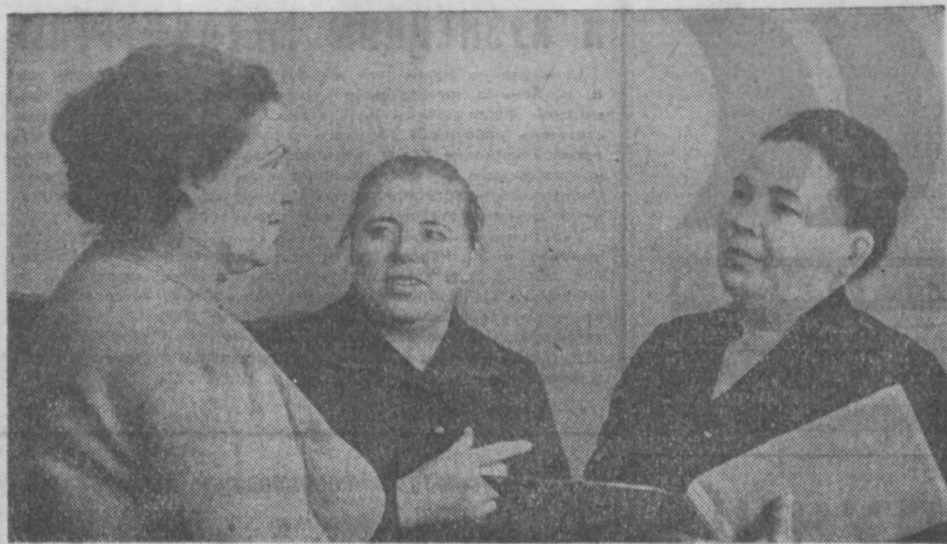
Внештатный отдел по торговле

В своем решении областной комитет обязал беловских народных контролеров устранить отмеченные недостатки, сосредоточить главные усилия внештатных отделов, групп и постов на более активной борьбе за повышение эффективности промышленного производства. В решении содержатся конкретные рекомендации.