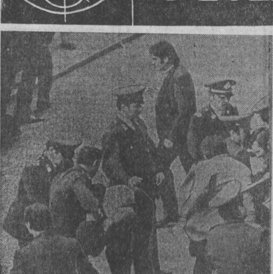
Греческие власти усиливают репрессии против студенчества, выступающего за демократические преобразования в высших учебных заведениях и отмену закона, согласно которому правительство может лишать их права продолжать учебу и призывать на военную службу. Целью такого закона является удаление из институтов прогрессивно настроенной молодежи.

НИ СНИЖИЕ: греческая полиция расправляется с участниками студенческой демонстрации в Афинах.