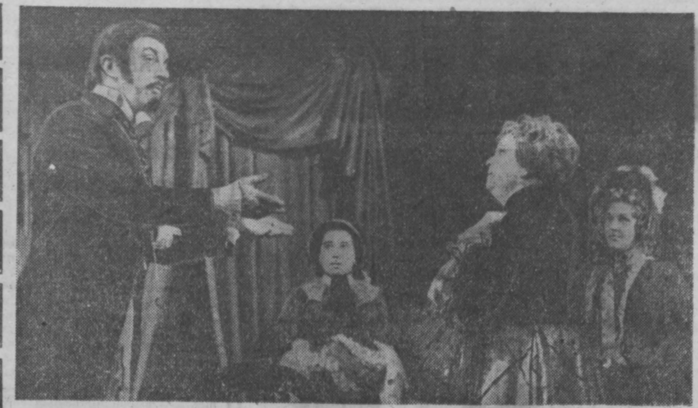
Московский академический театр имени Вл. Маяковского уже справил полувековой юбилей. Созданный в первые послереволюционные годы, он получил тогда имя театра Революции. С самого начала его коллектив борется за создание реалистического советского репертуара...

Викторина «Знаете ли вы ГАР?» ПЕВЦЫ Б. ПРЕМИИ