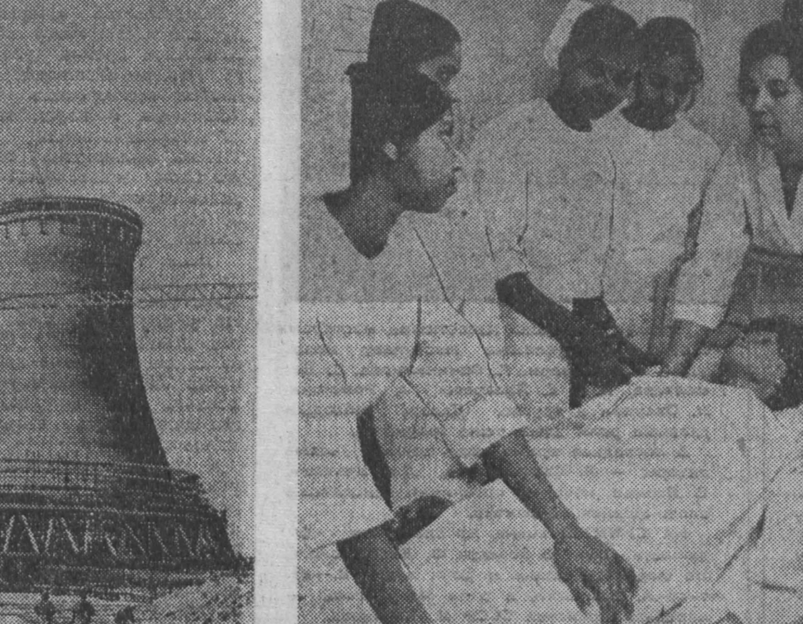
Лейпцигская больница готовит национальные медицинские карты для Республики Бангладеш. В лейпцигской областной больнице «Сент-Жорж» обучаются 17 девушек из Республики Бангладеш. В течение двух лет они пройдут полный теоретический и практический курс медицинских сестер.