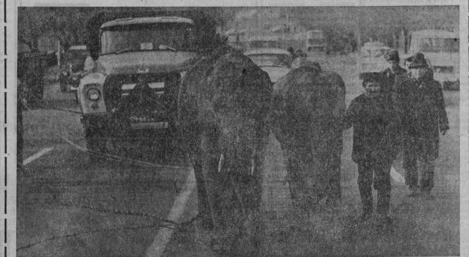
АРМЯНСКАЯ ССР. Вова и Белла — симпатичные слонята. Недавно они прибыли из ГДР в Ереван на постоянное жительство.

Словами, не волнуясь — берите свое здоровье! И здоровье окружающих! В. СМЕРНОВ, кандидат медицинских наук.