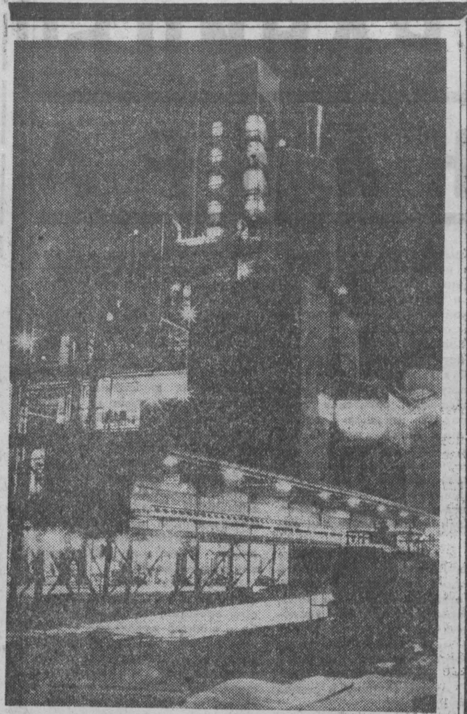
2 миллиона тонн искусственных удобрений выпустит в 1973 году Петский химический комбинат...