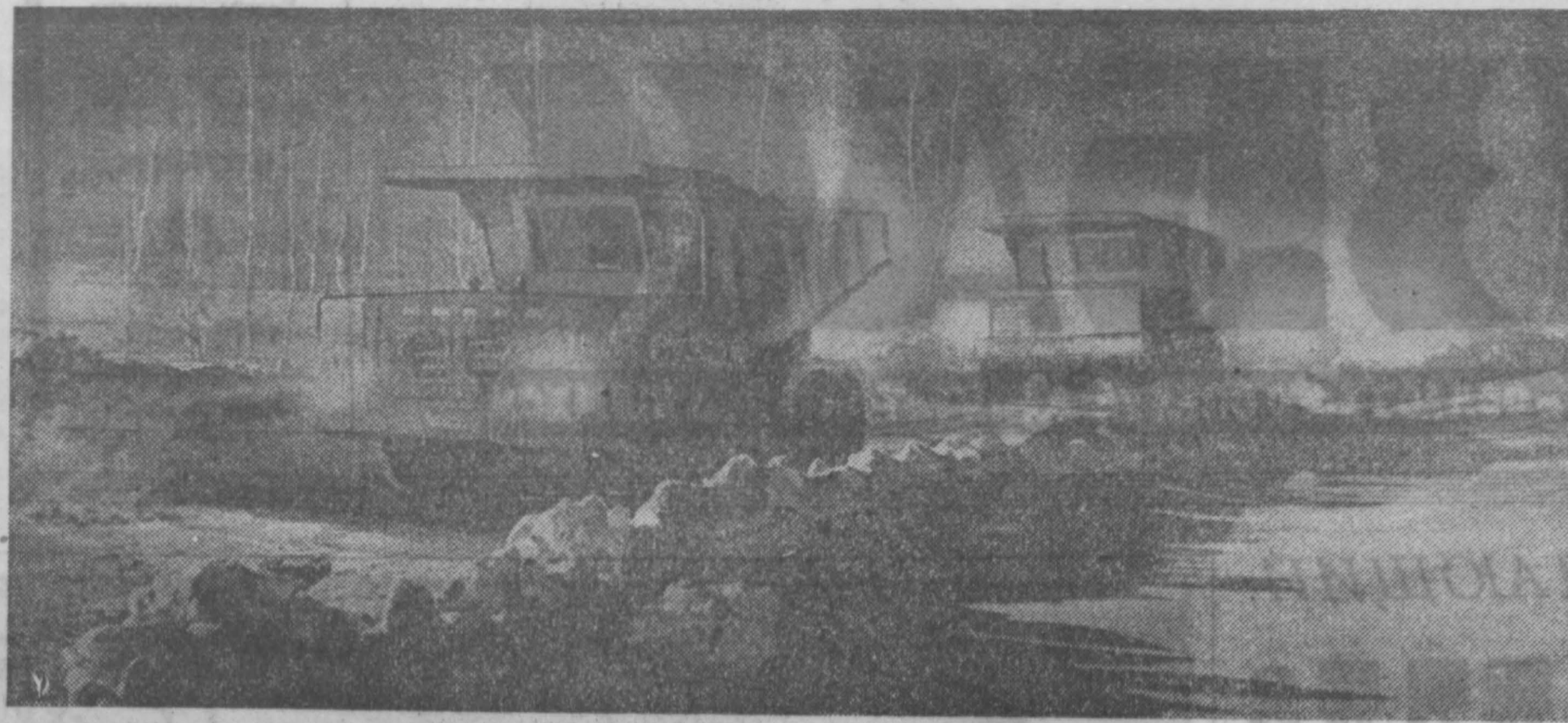
Угольный разрез им. 50-летия Октября — одно из крупнейших предприятий области. Сейчас, когда заканчивается реконструкция его первой очереди, суточная добыча составляет 9.400 тонн. В числе первых предприятий Кузбасса коллектив начал до- бывать конъюнкционный уголь открытым способом. В следующем году девятой пятилетки он нарастит темпы угледобычи. Ни днем, ни ночью здесь не прерывается трудовой ритм. Обязательство добыть в год 35 тысяч тонн угля сверх задания выполняется с начала года дополнительно к плану уже добыто более 20 тысяч тонн. Вскрышу пластов угля механизаторы ведут также с опережением графика.

В. КУРКОВ, машинист-инструктор, г. Белово.