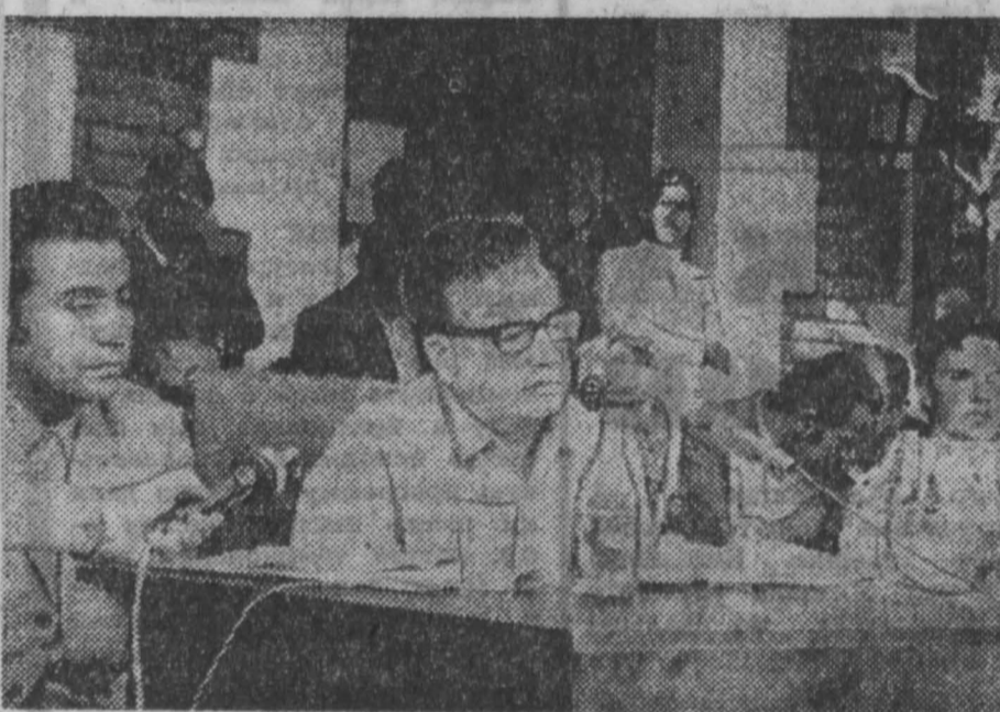
Террористы были взяты под стражу службой безопасности.

ХАРТУМ, 5 марта. (ТАСС). Как сообщили правительственные радио Судана, в ответ на требование суданского правительства члены восточной террористической организации «Черный сентябрь», вчера утром сдались суданским властям, освободили оставшихся в живых заложников и передали тела трех убитых иностранных дипломатов.