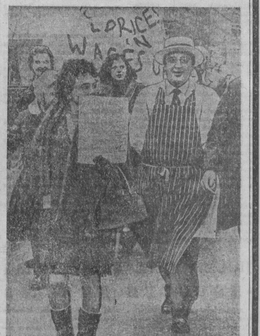
АНГЛИЯ. Трудящиеся страны решительно отвергают принудительное «замораживание» заработной платы, навязанное правительством консерваторов. НА СНИМКЕ: во время демонстрации работников торговых предприятий Лондона, в поддержку своего требования о повышении заработной платы.

Правительство консерваторов по-прежнему не намерено устанавливать действенный контроль над ценами на продукты питания. Это следует из опубликованного здесь нового свода правил, которым должны руководствоваться правительственные организации, занимающиеся вопросами заработной платы и цен. Вне правительственного контроля остаются цены на многие основные продукты питания, такие как мясо, птица, рыба, яйца, фрукты и овощи, которые уже подорожали с ноября прошлого года, когда правительство ввело «замораживание» заработной платы и цен, в среднем на 14 процентов. Все же цены на продовольствие с момента прихода консерваторов к власти в 1970 году возросли, как об этом заявил министр сельского хозяйства, рыболовства и продовольствия Англия Годбер, в среднем на 27,4 процента. Характерно, что в то время, когда цены на многие товары широкого потребления и продовольствие резко возрастали, заработная плата трудящихся оставалась на том же уровне. Новый правительственный документ устанавливает ряд ограничений на повышение зарплат в ближайшие время. Публикация новых правил в области цен и заработной платы стала, таким образом, еще одним свидетельством антирабочей направленности политики консерваторов, проводящих дальнейшее наступление на жизненные интересы английских трудящихся. Лондон. (ТАСС.)