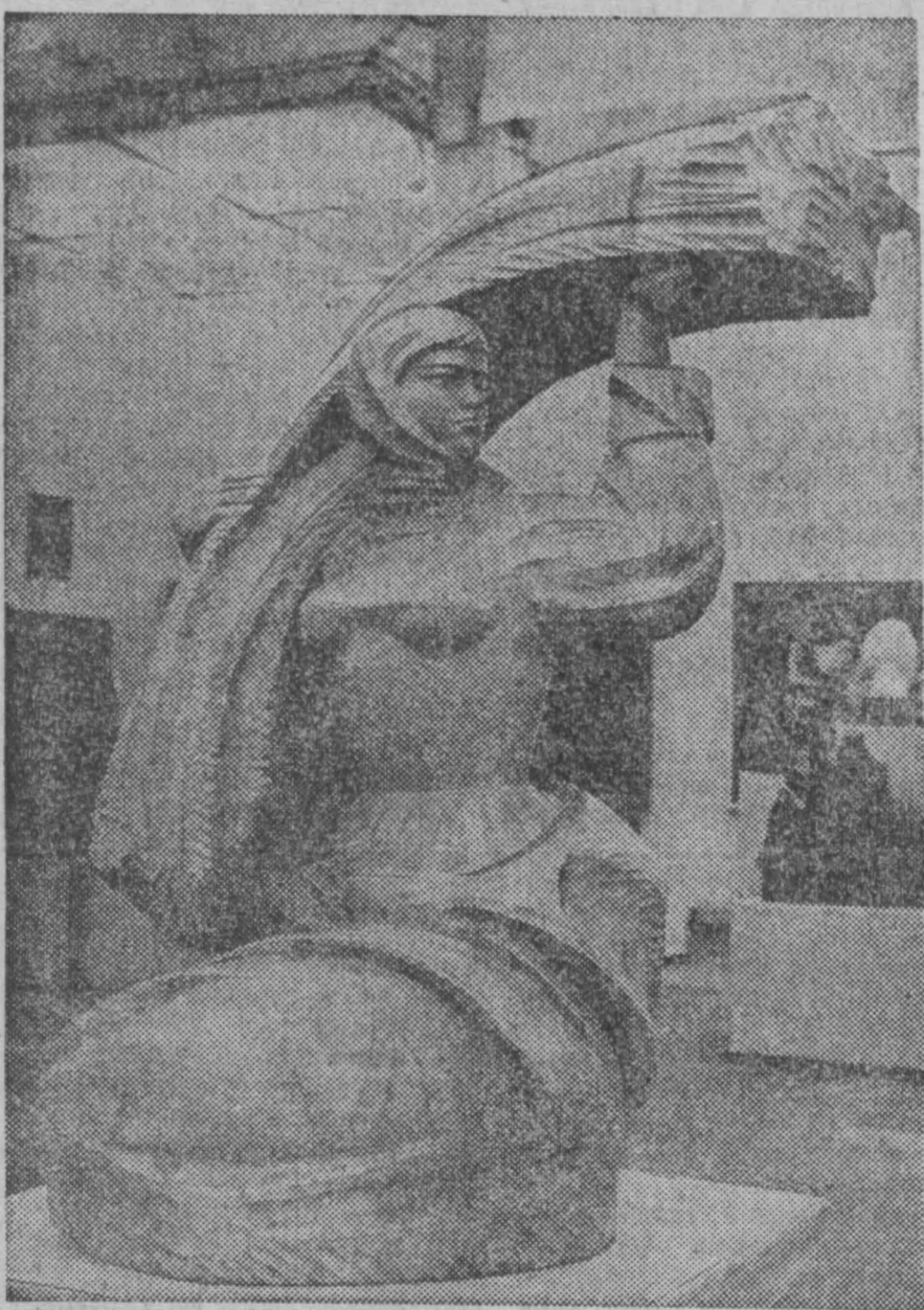
МОСКВА. В Центральном выставочном зале открыта Всесоюзная художественная выставка «СССР — наша Родина», посвященная 50-летию образования СССР. Экспонируется свыше 2.500 произведений живописи, графики, скульптуры, декоративно-прикладного искусства, работы художников театра и кино. Всего в выставке участвует 1.200 авторов.