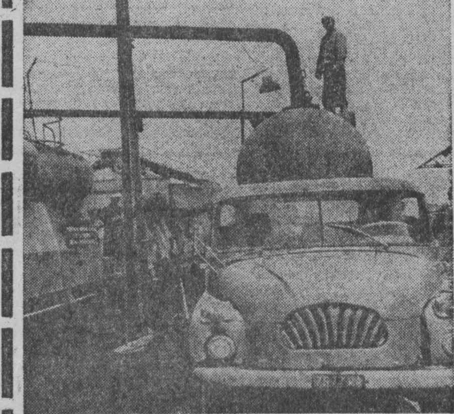
ПНР. Коллектив цементного завода «Дружба» в Вембже, построенного с помощью советских специалистов, отпраздновал свой 20-летний юбилей. Ежегодно завод выпускает 2,200 тысяч тонн высококачественного цемента. Такой рост производства стал возможен благодаря реконструкции предприятия, повышению производительности труда, использованию производственных резервов.