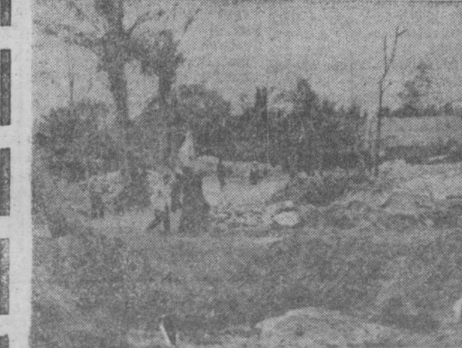
Американская авиация продолжает налеты на густонаселенные пункты ряда провинций ДРВ. НА СНИМКАХ: эти американские ракеты несут с собой разрушение и смерть.