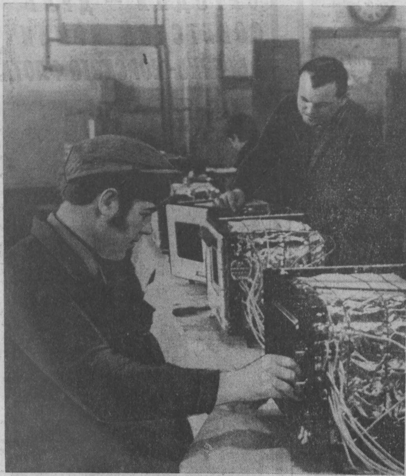
На кемеровском ордена Ленина заводе «Кузбассэлектромотор» бюро ширпотреба отделе главного конструктора разработано новую плитку-духовку «Тайга».