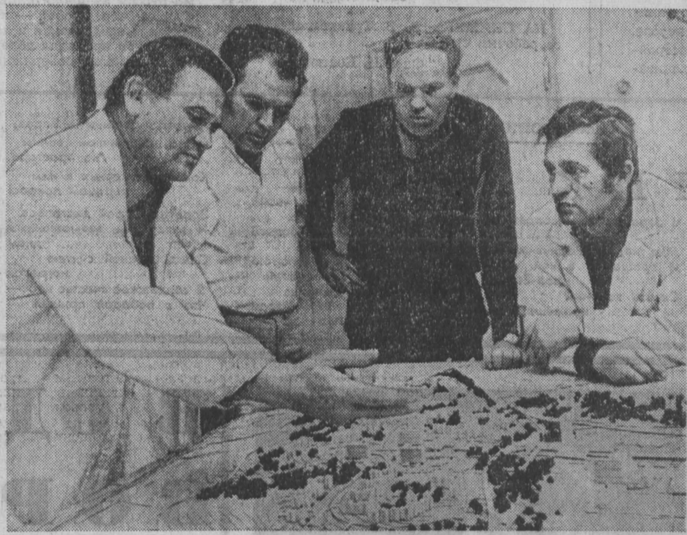
ЧССР. Именем чехословацко-советской дружбы будет назван жилой массив, создаваемый сейчас в районе Брно — Вогунция по проекту архитекторов предприятия «Ставопроект».