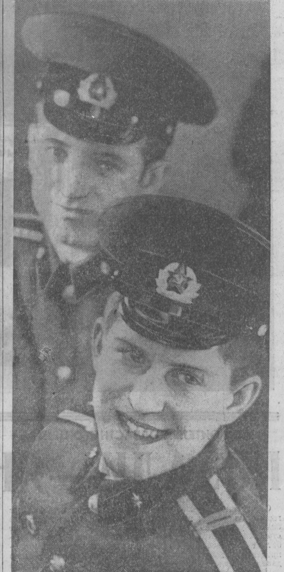
Каждый день несут службу курсанты Кемеровского высшего военного командного училища связи, внося свой вклад в укрепление обороноспособности Советского государства.

Выездная редакция газеты «Кузбасс» на Запсибе. г. Новокузнецк.