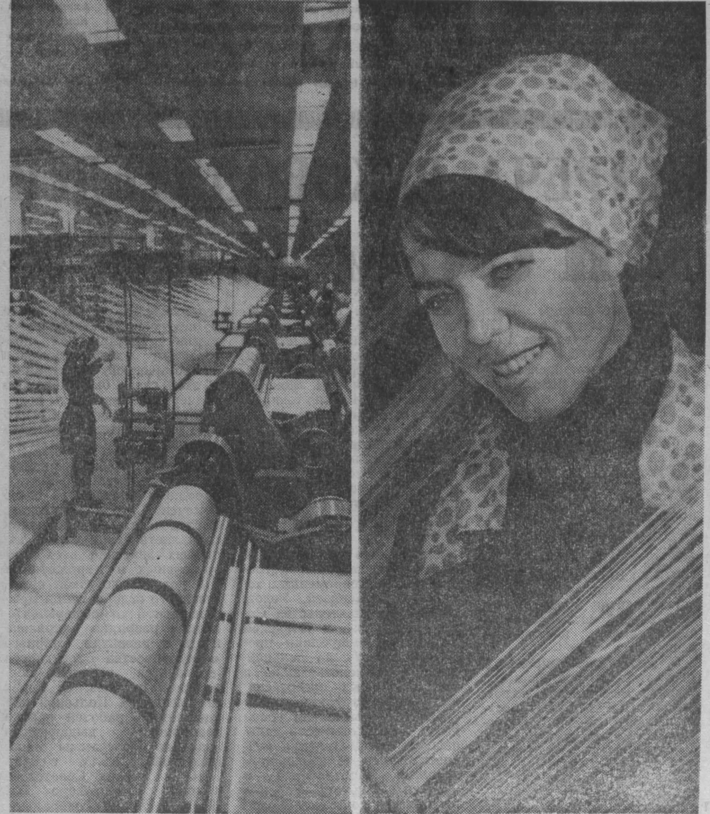
С каждым днем набирает мощность завод химического волокна. Уже работают прядильный цех, крутильные цехи № 1 и 2 и другие вспомогательные сооружения. Предприятие оснащено современным оборудованием. Недавно коллектив ткацкого цеха