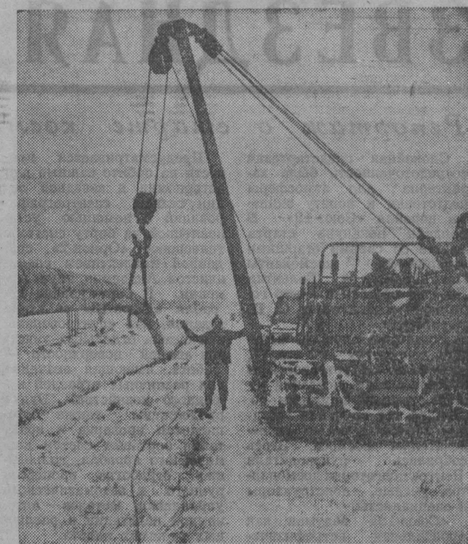
С каждым годом развиваются экономические связи братских социалистических стран. В соответствии с Комплексной программой СЭВ объединяют свои усилия нефтехимики Чехословакии и ГДР. Границу этих государств недавно переосек этиленопровод, который соединит в один производственный комплекс предприятия имени Чехословацко-советской дружбы в Залуни и соорумаемые в Белене (юнг Лейпциг, ГДР) химический комбинат. По этой новой промышленной магистрали в ЧССР для дальнейшей переработки будет переноситься часть этилена, полученного в Белене из советской нефти. Чехословацкие химики начнут поставлять в ГДР полуфабрикаты товаров широкого потребления.

НА СНИМКЕ: на лондонской бирже.