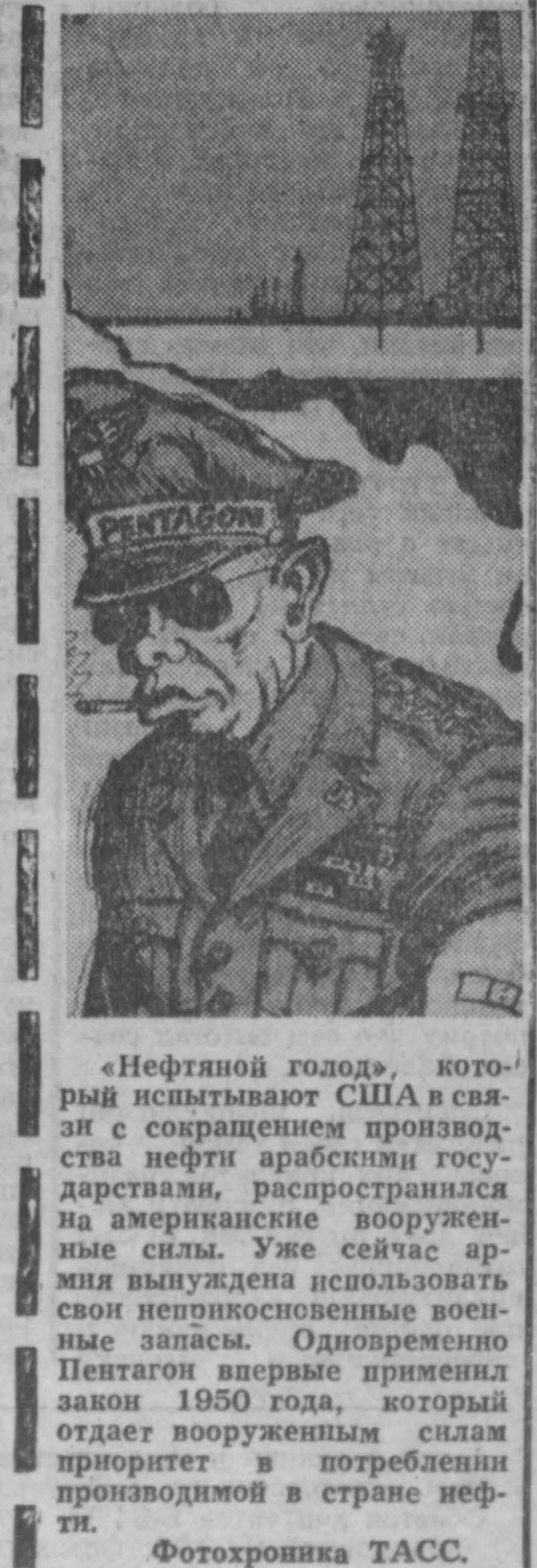
«Нефтяной год», кото-рый испытывают США в свя-зи с сокращением произво-дства нефти арабскими госу-дарствами, распространя-ет на американские воору-женные силы. Уже сейчас ар-мия вынуждена использовать свои неперископные воен-ные запасы. Одновременно Пентагон впервые применит закон 1950 года, который отдает вооруженным силам приоритет в потреблении производимой в стране неф-ти.