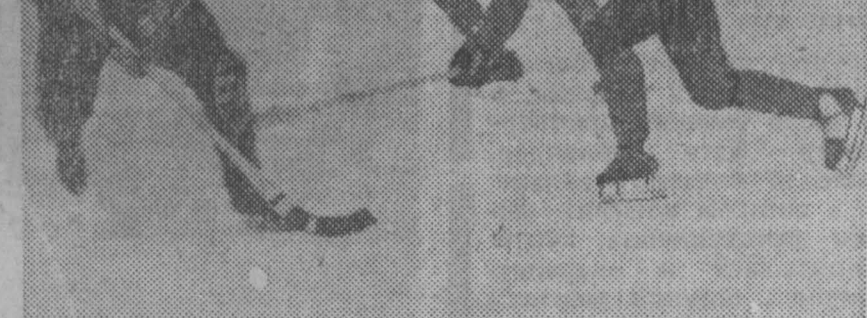
НА СНИМКЕ: момент игры. Атакуют гости.

Остальные встречи протекали в более острой борьбе: «Старт» (Горный) — «Водник» (Архангельск) — 4:3, «Локомотив» (Иркутск) — «Динамо» (Алма-Ата) — 2:4, СКА (Хабаровск) — «Литвиненко» (Нарганда) — 3:2, «Уральский трубник» (Первоуральск) — «Вымпел» (Калининград) — 4:4, «Виссей» (Красноярск) — «Зоркий» (Красногорск) — 3:3.