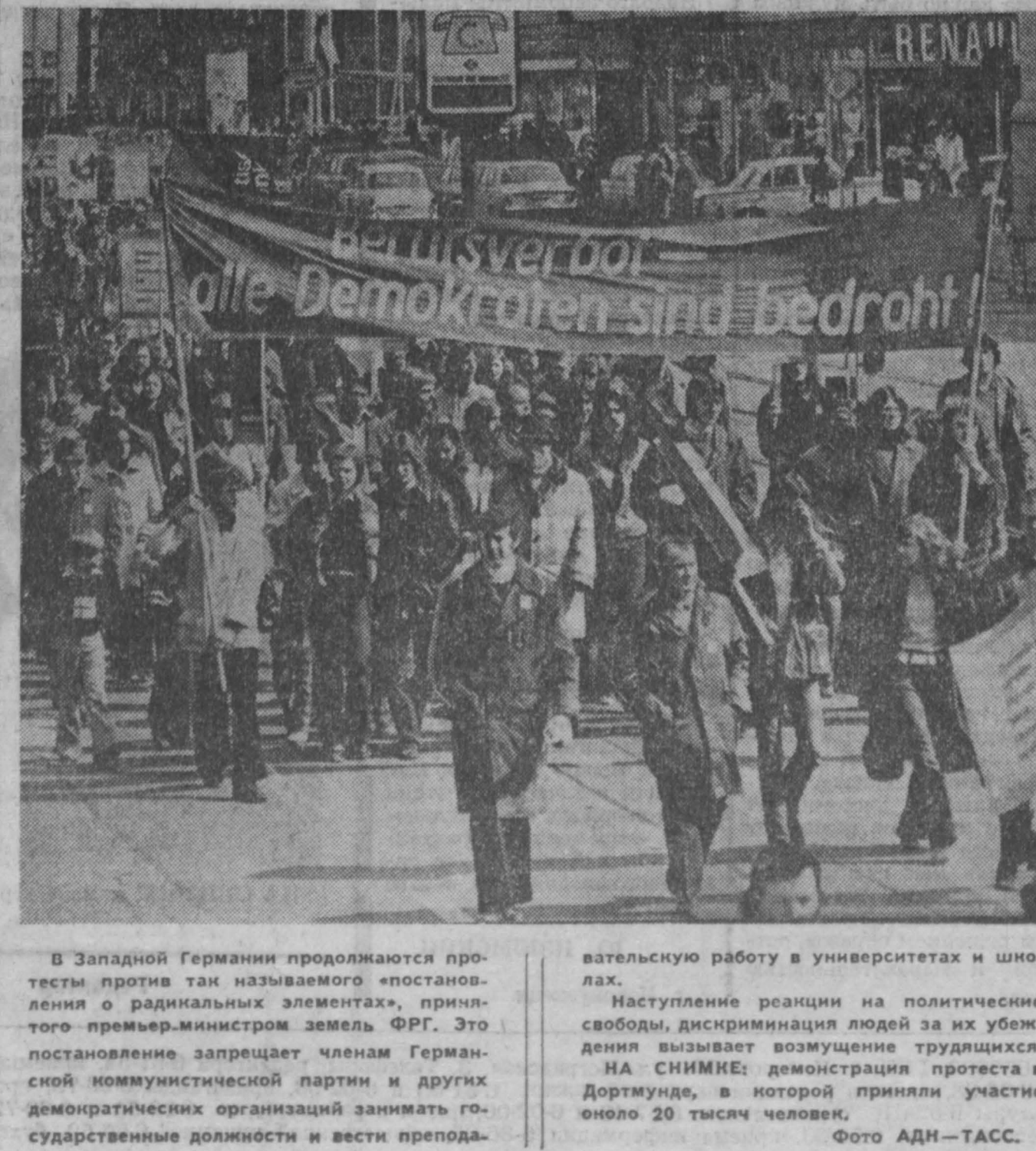
В Западной Германии продолжаются протес-ты против так называемого «постоян-ления о радикальных элементах», при-нятого премьер-министром земель ФРГ. Это постановление запрещает членам Герман-ской коммунистической партии и других демократических организаций занимать го-сударственные должности и вести препода-

А. КРАСНОВ, В. ГОНЧАРОВ, Н. ЧИГИРЬ, В. СЕРОВ, (ТАСС).