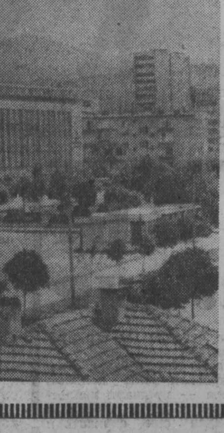
КАИР. Контр. ТАСС А. Суриков передает: Министерство информации АРЕ организовало для египетских и иностранных журналистов поездку в город Порт-Саид. Как известно, этот рискованный на берегу Средиземного моря город во время военных действий, возобновившихся на Ближнем Востоке 6 октября с. г., систематически подвергался ожесточенным налетам израильской авиации.

Судя по сообщениям, поступающим из Тель-Авива, там сейчас усиленно ищут причины неудач. Дипломаты выжили военных. Те — политических лидеров. Политики, в свою очередь, упрекают разведчиков за «неправильную информацию». Однако суть не в этом. Руководители Израиля не приняли во внимание главное — то, что в последнее время в международных отношениях наступил новый