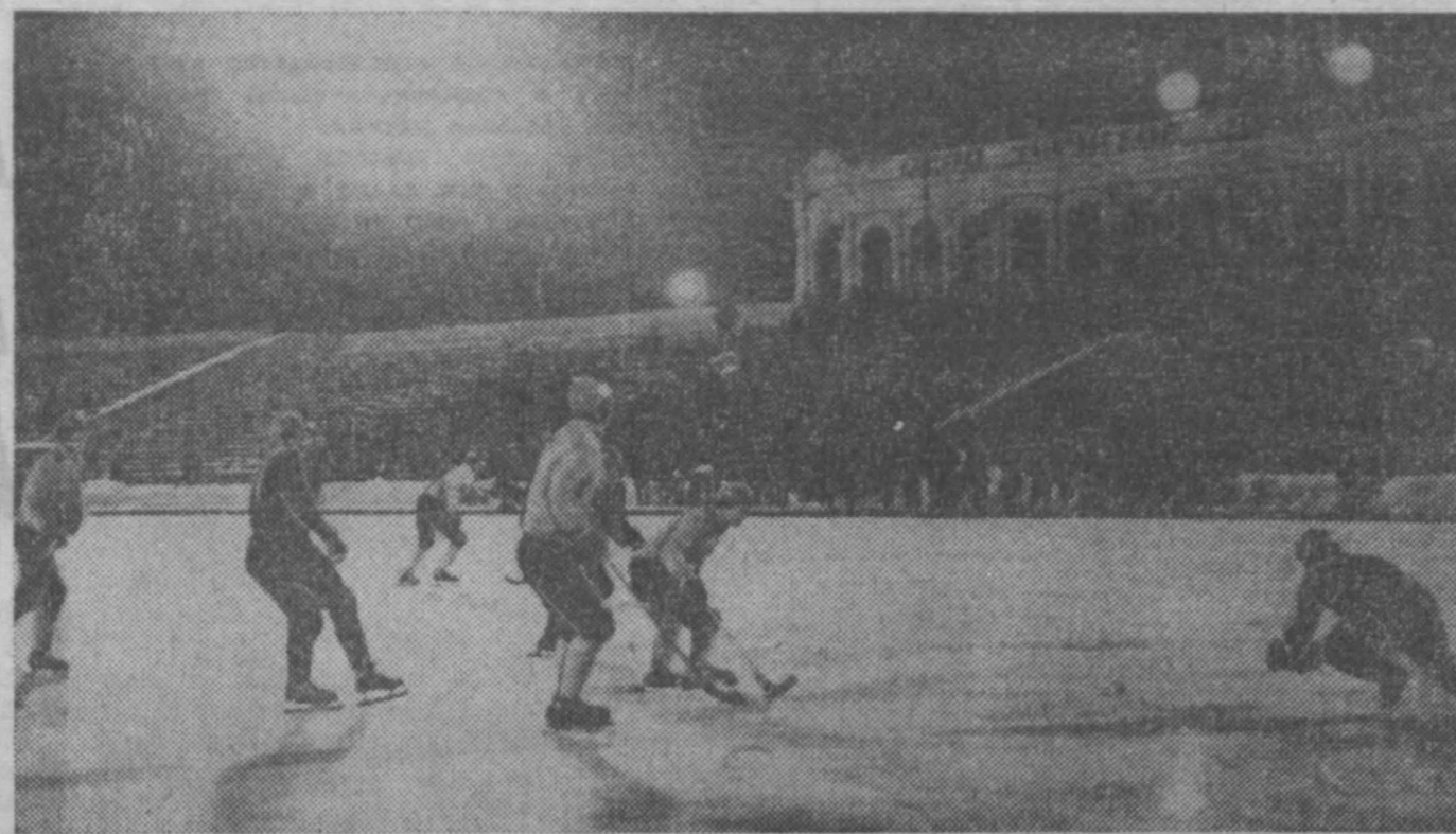
Повторная встреча хоккеистов «Кузбасса» с чемпионами страны — московскими динамовцами уже потому была интереснее, что проходила в идеальных условиях.