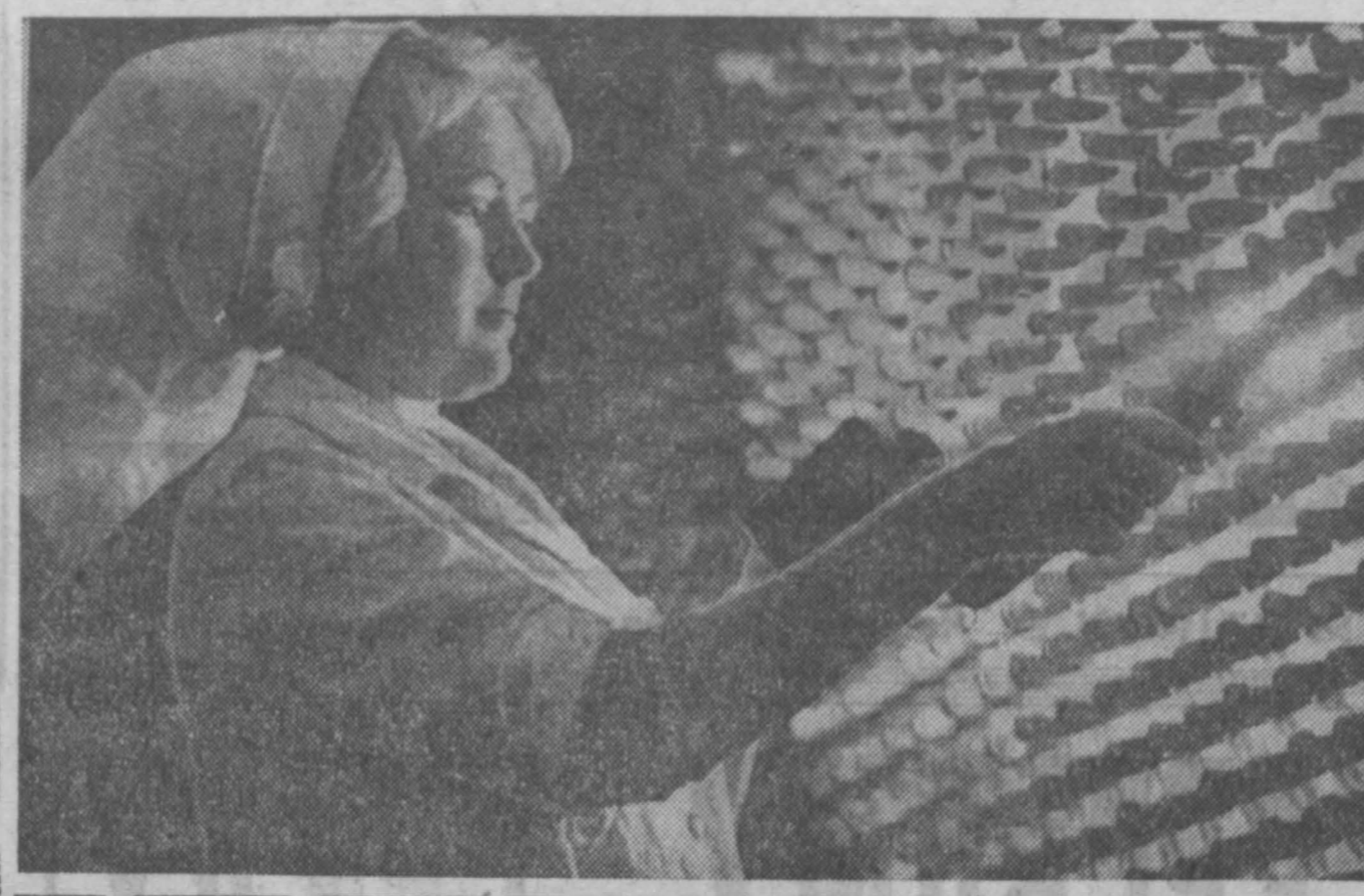
НА ГАЗЕТНЫЕ ТЕМЫ

Победителем Всероссийского социалистического соревнования городов области с населением менее 100 тысяч человек за лучшее проведение работ по благоустройству и санитарному содержанию в III квартале признан Междуреченск. Горисполком обеспечил выполнение плана капитального ремонта всего жилого фонда, коэффициента использования парков спецмашинами на санитарной уборке довел до 61. План строительства дорог и тротуаров выполнен на 110,7 проц. Населением города на благоустройство отработано 62 тыс. человеко-дней. Междуреченскому горисполкому присуждено переходящее Красное знамя Совета Министров РСФСР и ВЦПС и первая премия.