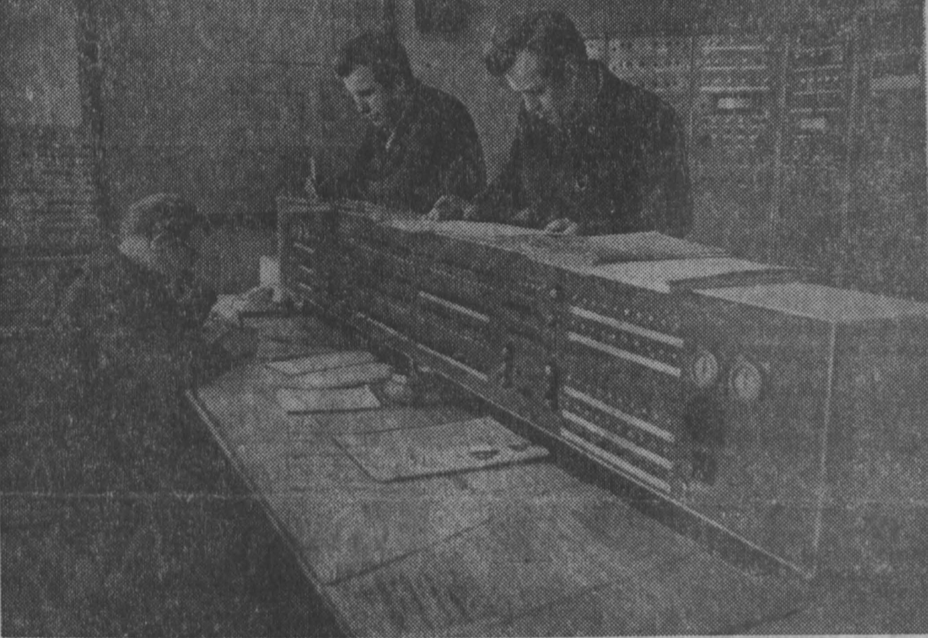
«Дежурка» шахты. Сюда стекается вся производственная информация.

Вот характерный пример (Продолжение на 3-й стр.)