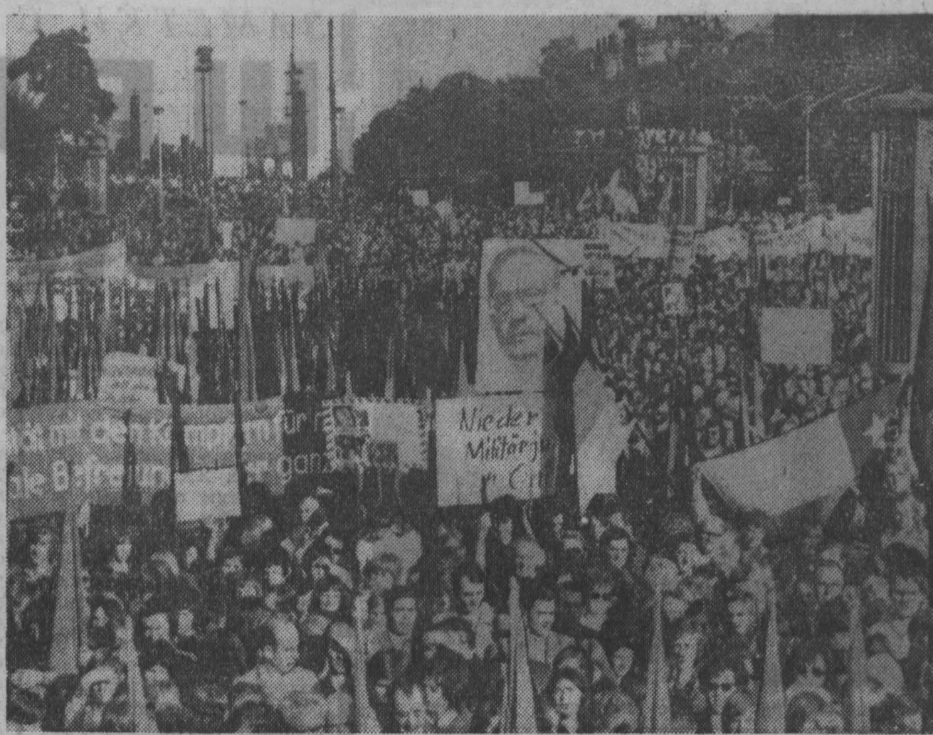
Демонстрация в Дрездене (ГДР).

В то время, когда генералы обрушивают на чилийский народ невиданные бедствия и страдания, в штаб-квартирах американских многокорпоративных компаний, корпорации «Интернэшнл телефон энд телеграф», которые были выдворены из Чили правительством Народного единства, царит, по словам газеты «Нью-Йорк пост», атмосфера ликования. Там готовятся к возвращению в Чили, к тому, чтобы снова прибрать к своим рукам чилийские природные богатства и беспрепятственно эксплуатировать чилийский народ. Иностранному капиталу, торопятся заверить главарей хунты своих покровителей, в Чили будет открыто самое широкое поле деятельности. Хунта уже приступила к передаче предприятий, национализированных правительством Народного единства или втянутых под рабочий контроль, их бывшим владельцам — магнатам чилийского капитала. Ожидается возвращения в свои поместья и чилийские латиноамериканцы, землевладельцы, которых были переданы крестьянам в соответствии с осуществленной народным правительством аграрной реформой.