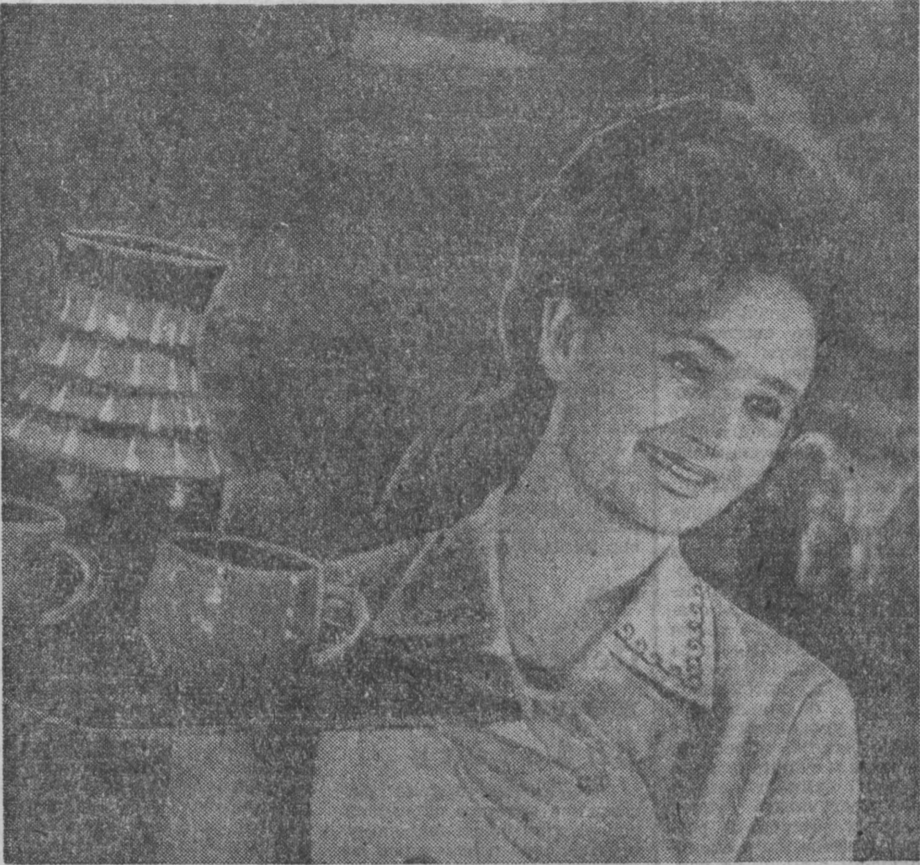
После ремонта вновь открылся ресторан «Славянский базар». По-новому выглядит отделка залов «Славянское утро», «Банкетный», «Рыбачий костер». Удобнее стало работать обслуживающему персоналу.