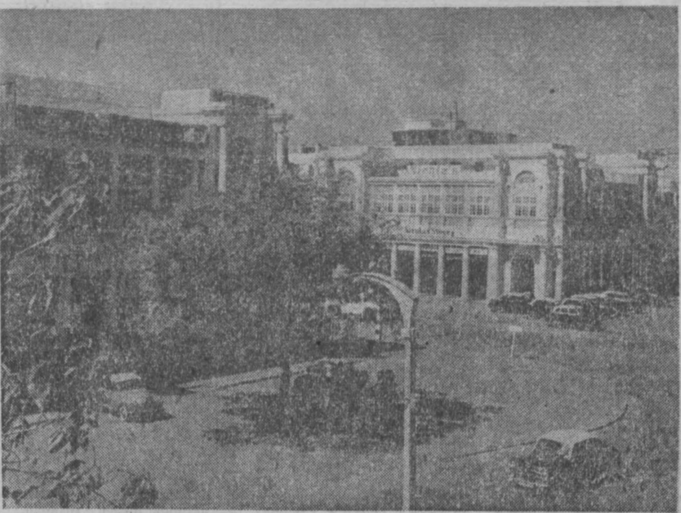
Уголок Дели, столицы страны.

ЖЕНЕВА. Глубокое удо- влетворение в связи с пара- фированием соглашения о прекращении войны и вос- становлении мира во Вьетнаме выразил Международный комитет Красного Креста. В опубликованном ком- мюнике комитет выразил надежду на установление прочного мира во всем Ин- докитае.