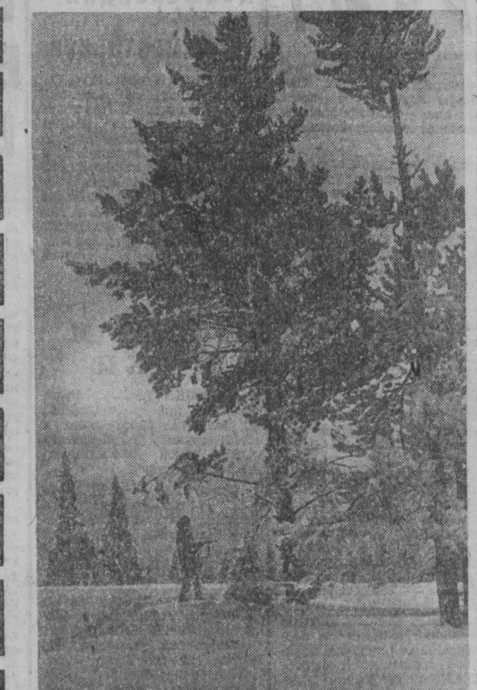
НА СНИМКЕ: зимний пейзаж в одном из живописных уголков Горной Шории. Богат этот край не только обилием и разнообразием полезных ископаемых. Богата Шория и тайменами, быстрыми порожистыми реками с харисунами и тайменами, ценной пушшиной...

Почетный гражданин... В самодержавной России ими могли стать имеющие власть да деньги. Построит купец, имеющий многомиллионный капитал, небольшую школу — глядишь, благодетелем стал, почетным гражданином провозгласят.