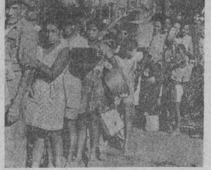
НИКАРАГУА. Основная проблема для жителей Манagua, оставшихся в живых после разрушительного землетрясения, — отсутствие продуктов питания и питьевой воды. На снимке: очередь за питьевой водой, которая доставля- ется из соседних стран на самолетах.