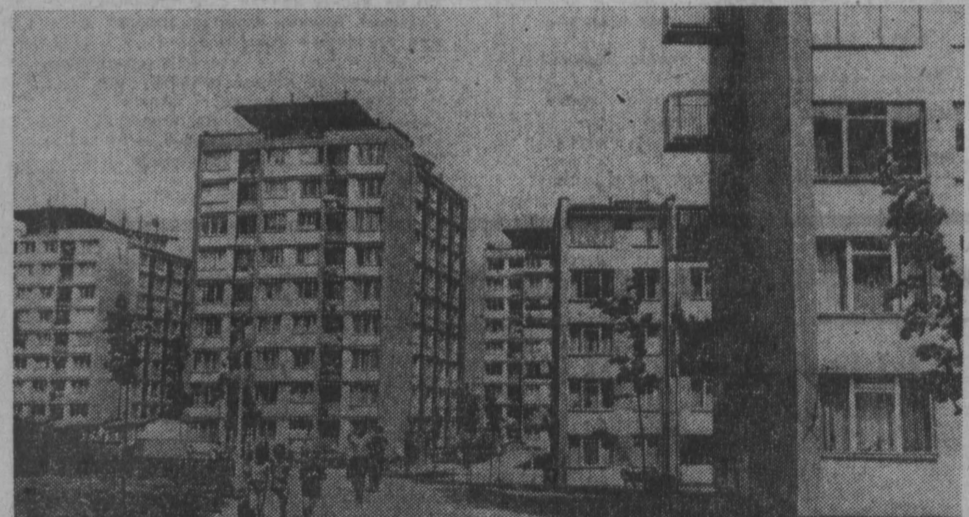
ПНР. Жилищные строения — самая характерная черта социальной политики Польши. Квартиры современных жилых домов возмост по всей стране. В новые благоустроенные квартиры в истемном году въехали свыше 125 тысяч семей ра-

Кинотеатр «МОСКВА» Цветной широкоформатный художественный фильм МАЧЕХА (10, 12, 14, 16, 18, 20, 21-55).