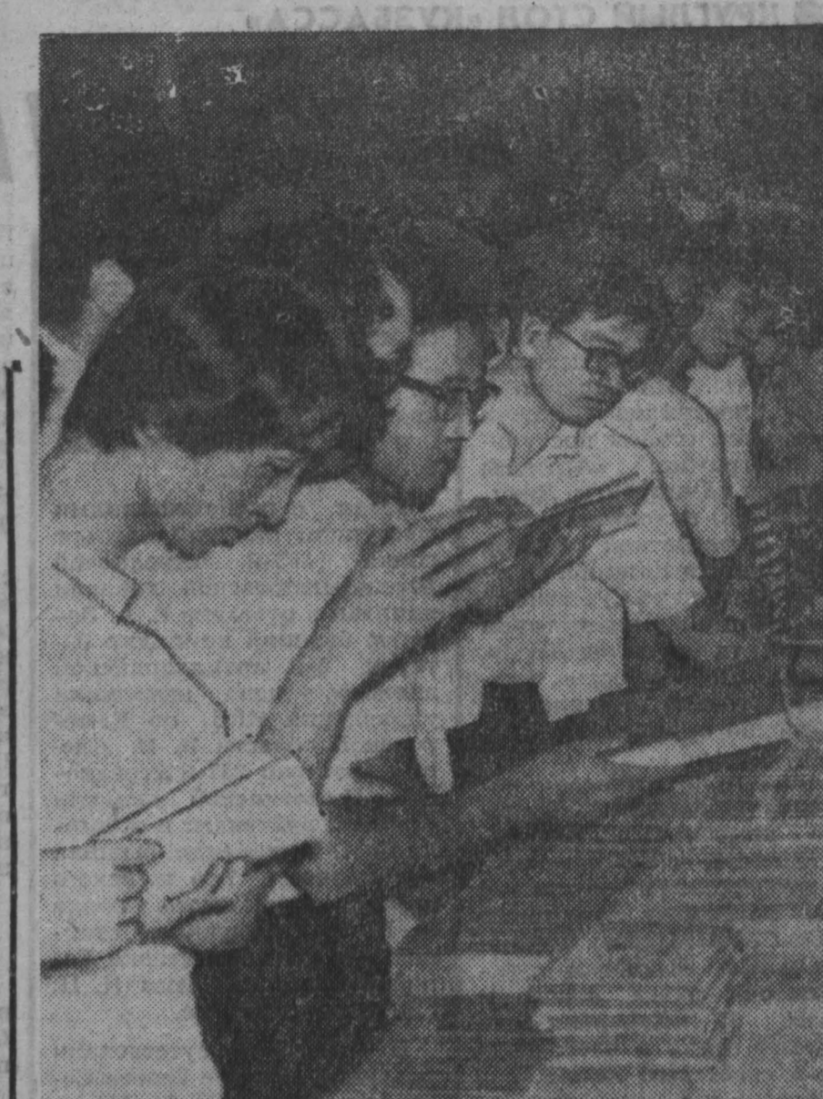
БОЛЬШОЙ популярностью в Японии пользуются летние курсы типа народного университета, организуемые ЦК КПЯ в 1970 году. С каждым годом увеличивается число слушателей, посещающих лекции по марксизму-ленинизму, теории научного социализма, истории коммунистической партии страны. НА СНИМКЕ: слушатели курсов во время перерыва между лекциями у книжного шкафа.

Подразделение израильских ВВС пыталось перехватить наши самолеты, возвращавшиеся на свои базы после выполнения поставленных задач. Наши самолеты вступили в бой и сбили один израильский «Фантом».