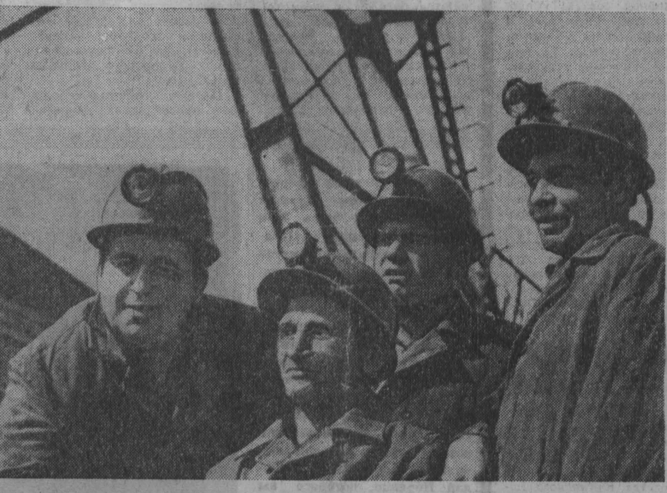
г. Киселевск.