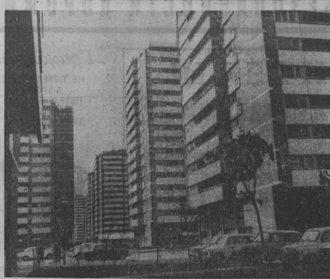
Страница Социалистической Федеративной Республики Югославии постоянно расширяет свои границы. Недавно в городе на левом берегу Савы вырос еще один микрорайон. Жители назвали его «Селением солнца». Поводом к этому поэтическому имени послужило архитектурное решение «проблема света», течение для солнца «упевает» побывать в каждом окне.