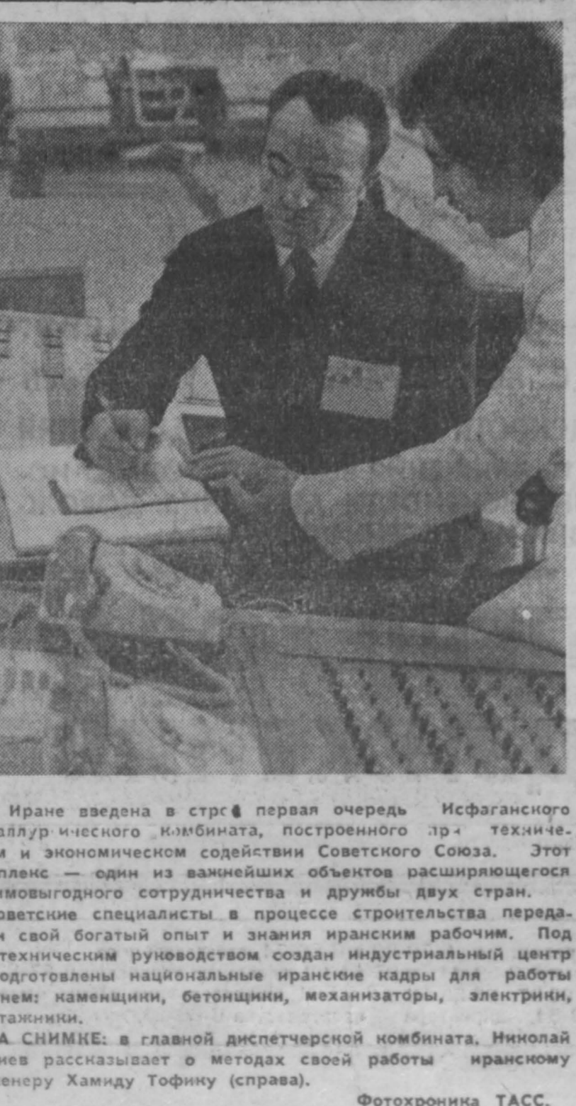
В Иране введена в строй первая очередь Исфаганского металлургического комбината, построенного с помощью и техникой и экономическим содействием Советского Союза. Этот комплекс — один из важнейших объектов расширяющегося взаимовыгодного сотрудничества и дружбы двух стран.