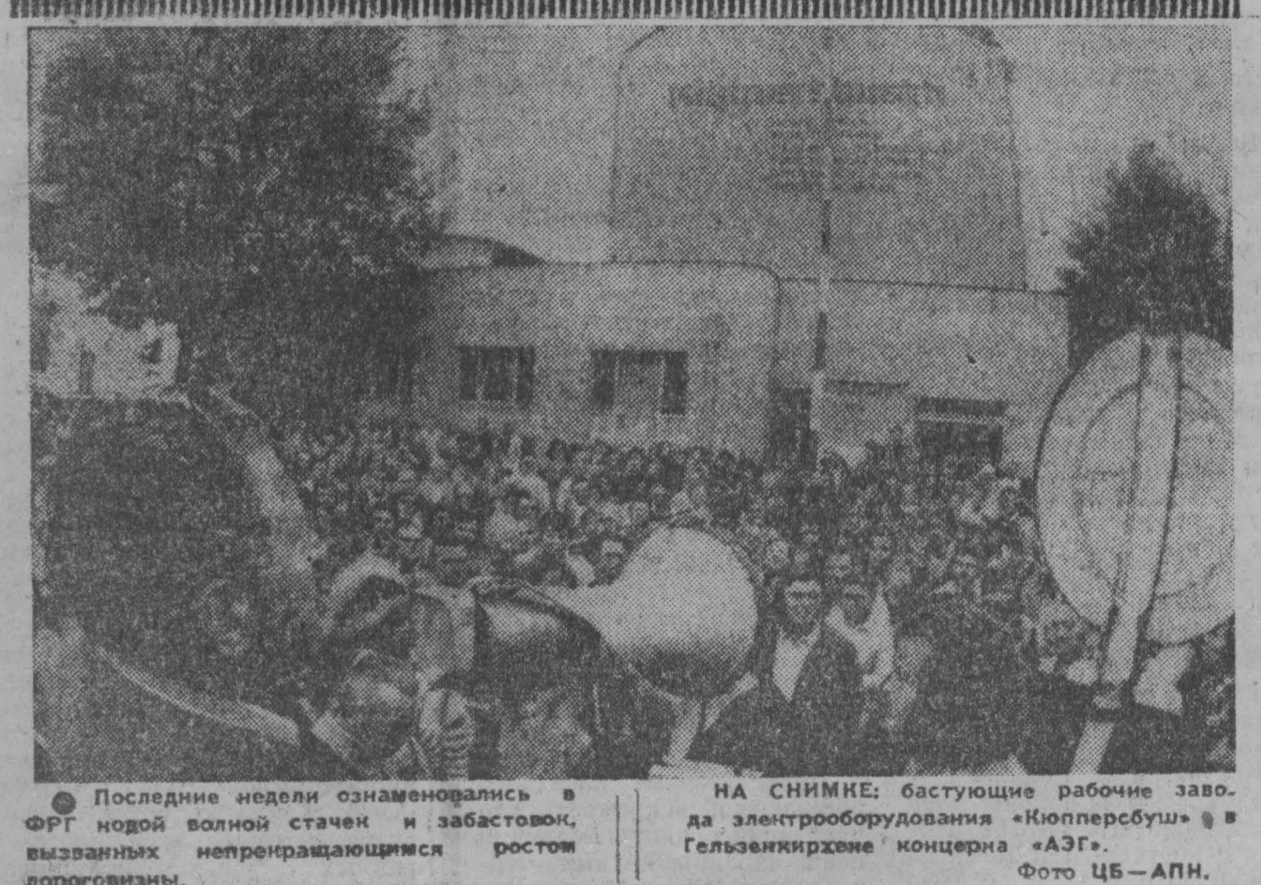
Последние недели ознаменовались в ФРГ новой волной стачек и забастовок, вызванных непрекращающимся ростом дорожных цен.

Как сообщает агентство Рейтер, представитель радикальной партии Чили заявил, что сопротивление кровавому режиму, установленному реакционными силами в результате военного переворота, будет продолжаться. Насильственное устранение конституционного правительства Сальвадора Альенде не оставит борьбу. «Нам», — отметил он, — придется использовать различные методы. Ясно, что мы не будем сидеть сложа руки... Сопротивление будет организовано таким образом, что, когда настанет момент для нанесения решающего удара, этот удар будет успешным. Главарь военной хунты вынужден признавать, что в различных местах Чили создаются партизанские отряды.