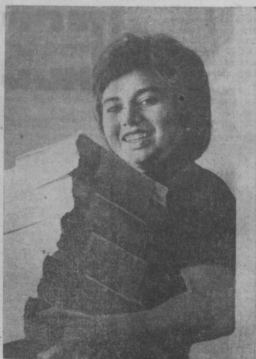
ЛЕНИНГРАД. Август — один из самых напряженных месяцев для работников ордена Трудового Красного Знамени фабрики «Светоч».