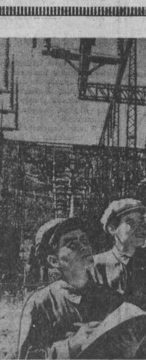
НА СНИМКЕ: на ГЭС в Чончжинге.

Уже проведено девять сеансов исследования природных ресурсов Земли. При этом отснято 125 растровых снимков. Сейчас наблюдения прерваны, но примерно через неделю они должны возобновиться, и