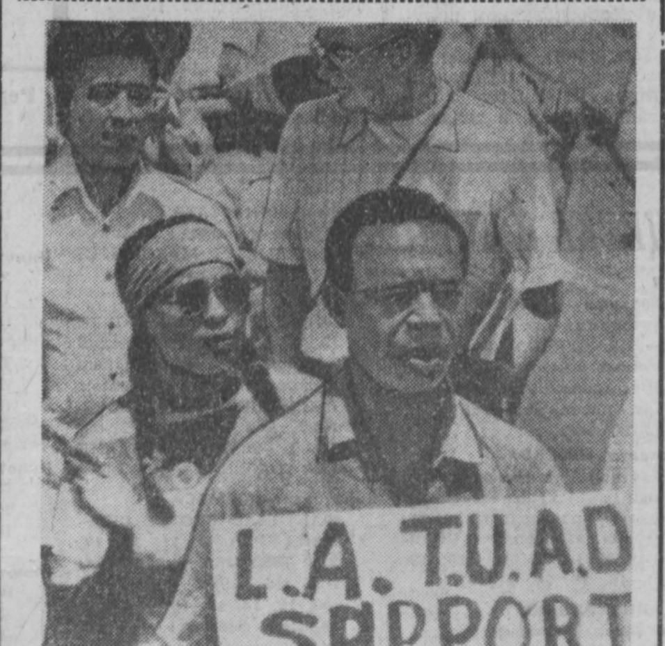
США. Около четырех месяцев продолжается забастовка сельскохозяйственных рабочих Калифорнии. Они добиваются от предпринимателей заключения нового трудового соглашения и ликвидируют виноградные плантации, не допуская на них штрейкбереров. Плантаторы бросили против бастующих полицию. Общее число арестованных превысило 2,5 тысячи человек. В результате столкновений с полицией многие ранены. НА СНИМКЕ: один из пикетов бастующих.

Всё по обе стороны автомагистрали было новым, ярким, колоритным. Самой яркой деталью пейзажа возвышался по плану «Шинья Бонита», в соответствии с которым на Кубе создается индустриальное, основанное на современных методах генетики и механизации, животноводческое хозяйство. Ра-