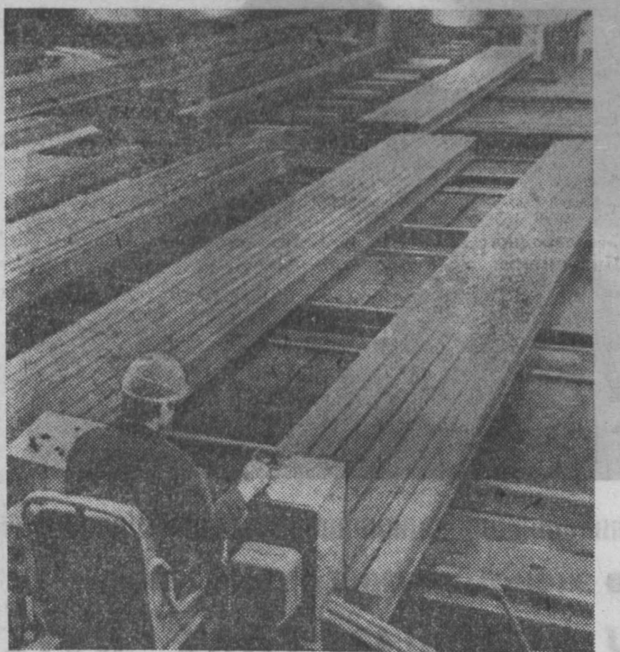
Давно известным высоким мастерством кузнецкие металлурги, и ныне они работают по-ударному. Наш фотокорреспондент К. Петров побывал в рельсобалочном цехе, Коллектив трудится с высоким напряжением, успешно справляется с гордыми социалистическими обязательствами. На снимке (слева) вы видите готовую продукцию рельсобалочников.

Межзаводское соревнование у нас освещается на стенде, по типу экрана телевизора. В честь победителя поднимается флаг на предавдской площади. Книга почта, куда заносят