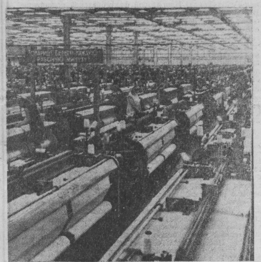
Коллектив тшацкого цеха № 3 (параллельно этому цеху вы видите на снимке справа) по выпуску продукции уже выходит на уровень планового задания. Сейчас тшацкий ежемесячно вырабатывает 775 тысяч погонных метров суровы.