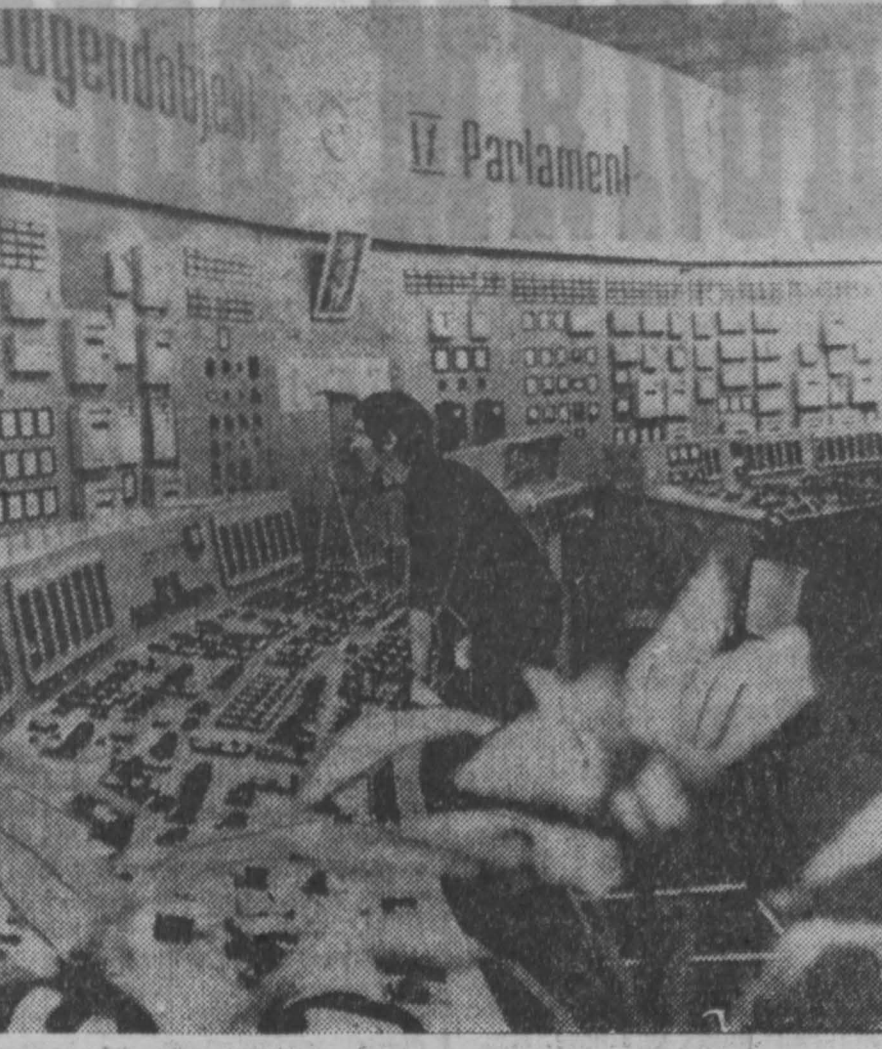
Этот снимок сделан на крупнейшей тепловой электростанции Германской Демократической Республики в Боксберге. Недавно здесь с двухмесячным опережением графика были пущены в ход агрегаты первой очереди.

Как указывает печать, прекращение безвозмездной военной помощи афинскому режиму, Соединенные Штаты будут, как и раньше, продавать оружие и военное снаряжение Греции в кредит на льготных условиях.