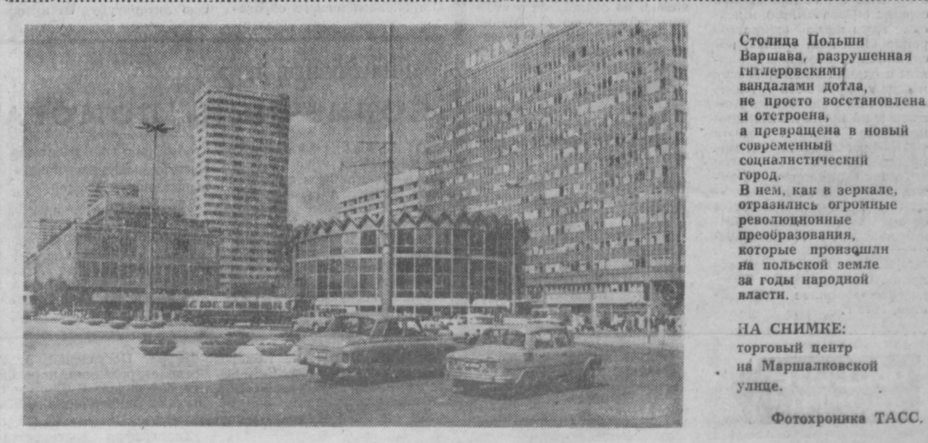
Стоица Польши Варшава, разрушенная гитлеровскими выдателями дотла, не просто восстановлена и отреставрирована, а превращена в новый современный социалистический город. В нем, как в зеркале, отразились огромные революционные преобразования, которые произошли на польской земле за годы народной власти.