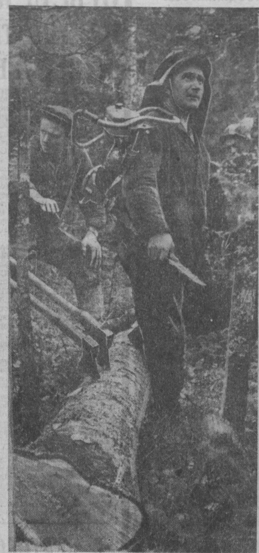
Маринский лесопромышленный комбинат... Десяти тысяч кубометров строительного леса...