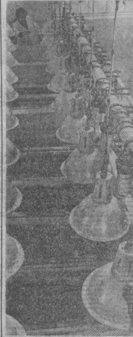
МОЛДАВСКАЯ ССР. В колхозе «Молдова» Нотосского района построен цех круглогодичного выращивания хлореллы. Ежедневно он дает шестьдесят тонн пасты хлореллы и суспензии — ценных витаминных добавок к кормам для крупного рогатого скота, свиней и птицы.