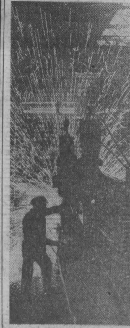
250 тонн стальных труб новой конструкции, используемых при разведке в бурении скважин, изготовлены на нефтепрокатном заводе нефтяников Западной Сибири к концу 1973 г. от Азербайджанского трубного завода.