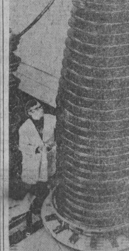
Ученые Томского научно-исследовательского института ядерной физики в Сибири разработали и пустили новую установку — сильноточный наносекундный ускоритель прямого действия на энергию 2 миллиона электрон-вольт, силой тока 80 микроампер и длительностью импульса 80 наносекунд (наносекунда равна одной миллиардной доле секунды).