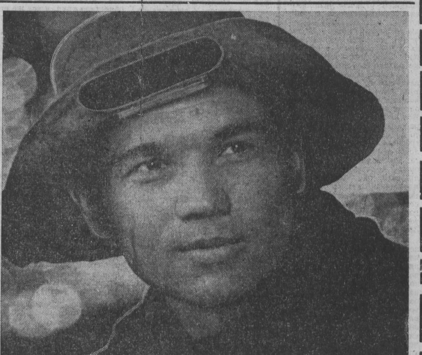
Новокузнецкие ферросплавщики стали на ударную вахту в честь Дня металлурга. Они трудятся под девизом: дать продукции больше, лучшего качества, с наименьшими затратами.

даевская», «Нагорная», «Алардинская», «Октябрьская», «Шольсаевская», «Кольчугинская», им. 7 ноября, «Восход», «Маганак», разрезов «Проктопьевский» и «Байдаевский». Горняки прилагают все усилия, чтобы до конца июня добыть не менее 2 миллионов тонн в счет обязательств решающего года пятилетия.