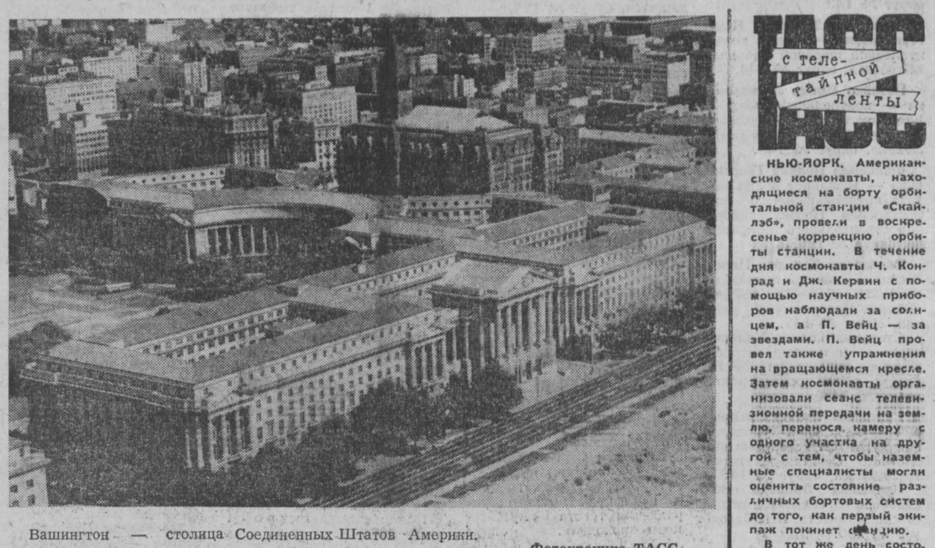
Вашингтон — столица Соединенных Штатов Америки.