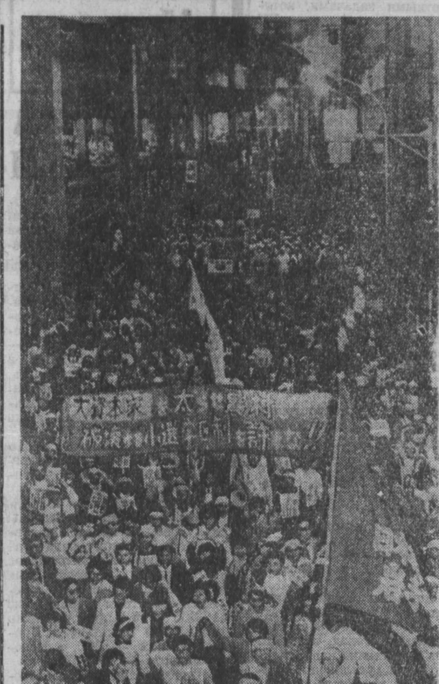
Единые действия протеста прогрессивных сил Японии против планов правительства добиться пересмотра избирательной системы в стране, чтобы таким образом сохранить за собой большинство мест в парламенте, закончились успешно. Правительство отказалось от своих планов. В выступлениях приняли участие представители коммунистической и социалистической партий, генерального совета профсоюзов, совета связи независимых профсоюзов, женских, молодежных и других массовых организаций страны. НА СНИМКЕ: демонстранты на улицах Токио.

История Аргентины последних лет была отмечена активным противодействием трудящихся масс политике